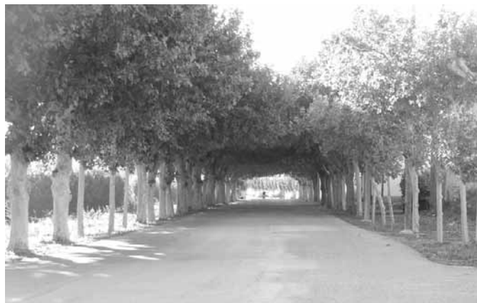
Passeig de Sant Ramon des de l'oest

darrer mas gran, abans de començar a enfilar cap a Castellldans. Si pareu a l'entrada, hi trobareu un altre passeig arbrat; plataners i tanca vegetal, romanticisme, el pas del temps, el marc del mas al fons, i l'encant dels arbres que l'ésser humà ha plantat.