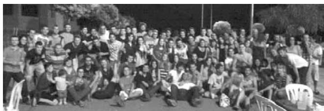
Participants al sopar popular del jovent

va haver instal·lats JOCS AQUÀTICS. A les 7 de la tarda, a la pista poliesportiva, es va representar un ESPECTACLE INFANTIL, a càrrec del grup FESTA SALADA, el qual amb la seva