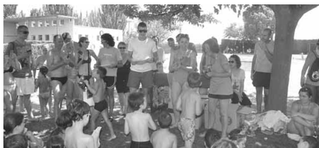
Lliurament de diplomes als participants