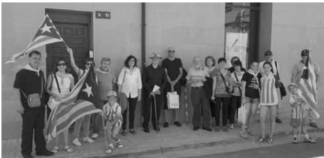
Artesencs i artesenesques que es van desplaçar a Barcelona per assistir al concert

Artesa per la Independència , integrada dins de l'Assemblea Nacional Catalana del Segrià, també hi va estar present. Des del nostre poble vàrem omplir un autocar amb persones que no es van voler perdre aquest esdeveniment.