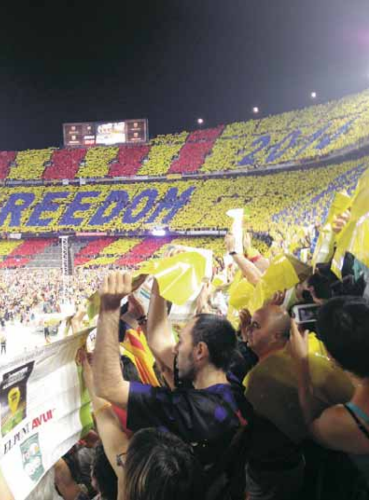
CONCERT PER LA LLIBERTAT