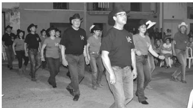
Actuacion del grup de country Aspavil