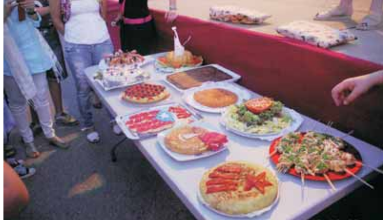
ASSORTIT DE TRUITES DEL SOPAR A LA FRESCA