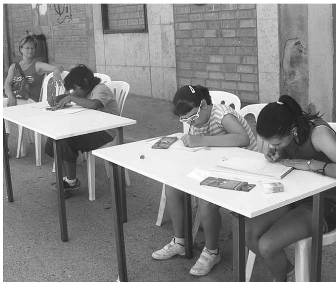
Concurs de pintura ràpida infantil