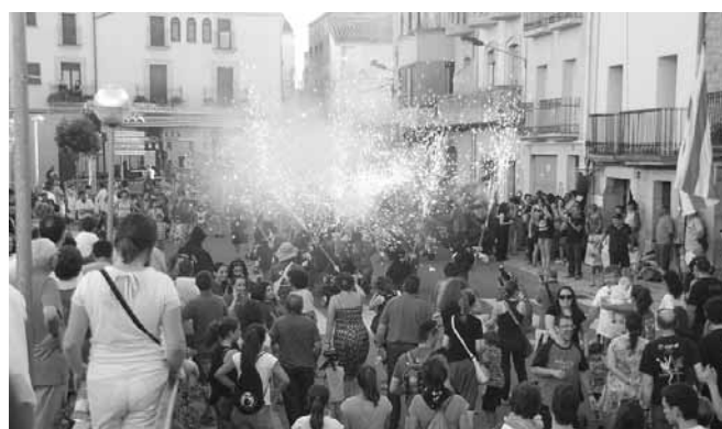
Correfoc dels Diablons del Griu

A 2/4 de 8 de la tarda es va donar inici al Correfoc infantil , pels carrers de la població, a càrrec de la colla infantil els diablons del Griu d'Artesa de Lleida , acompanyats del grup de percussió FESTA'M TAM I KUMBEVA