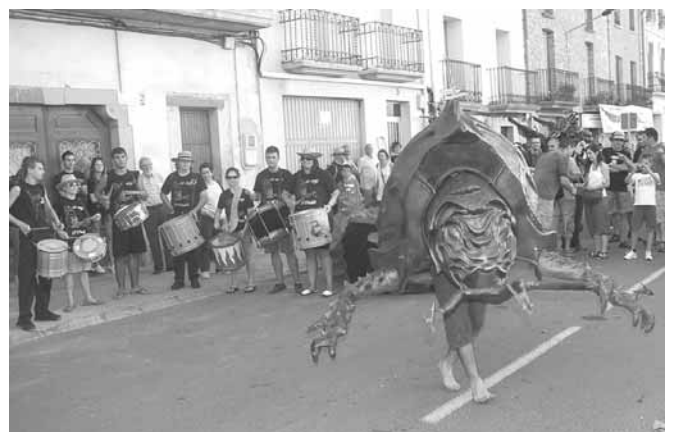
El Diabló de la Selva del Camp