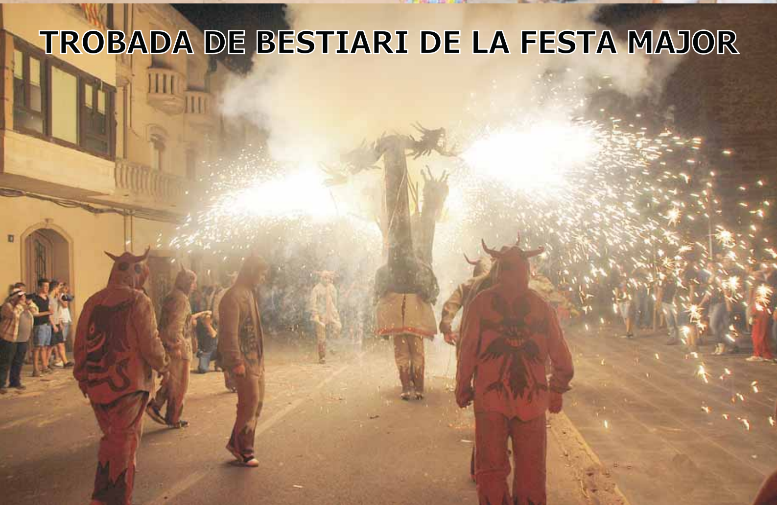
TROBADA DE BESTIARI DE LA FESTA MAJOR