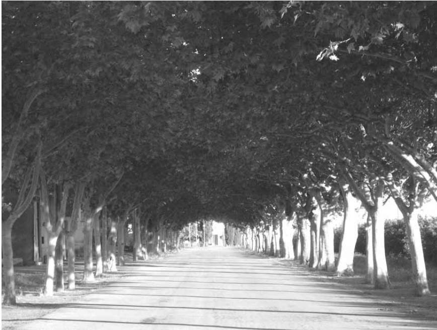
Passeig de Sant Ramon des de l'est

Parlar de cases i construccions, sí. Però també havia escrit que podria parlar sobre tot d'allò construït que em genera algun sentiment . Volia avui parlar d'un altre tipus d'obra humana, que quan la veiem o hi circulem, normalment la gaudim, la fruïm; em refereixo als passejos arbrats.