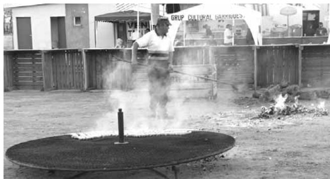
Cuita de llonganissa pel sopar de germanor

El sopar va estar amenitzat, amb la música del