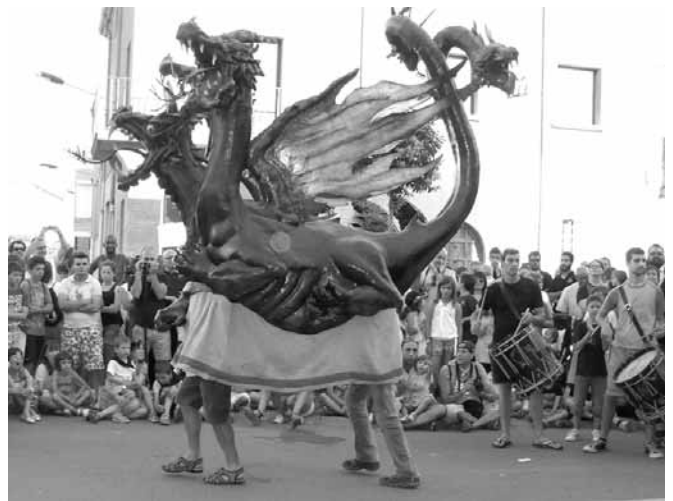
El Badalot de l'Arboç,