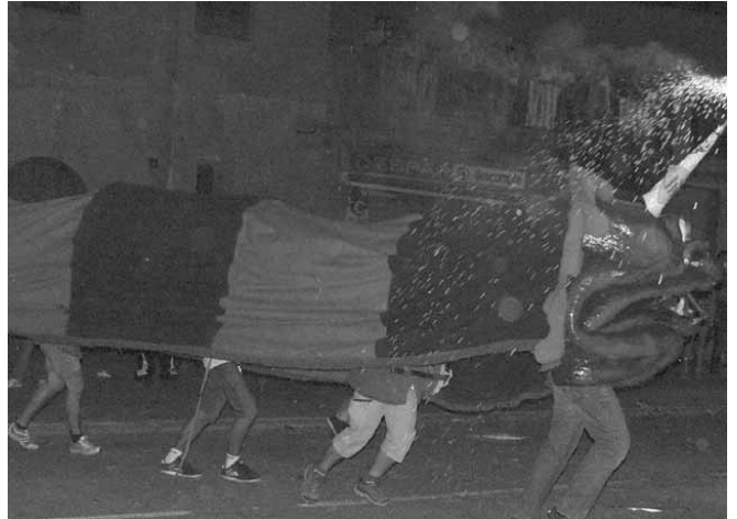
Actuació de la Cuca de Castellbisbal

Illuïment pirotècnic, acompanyat amb musica del grup musical.