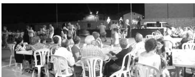
Sessió de ball