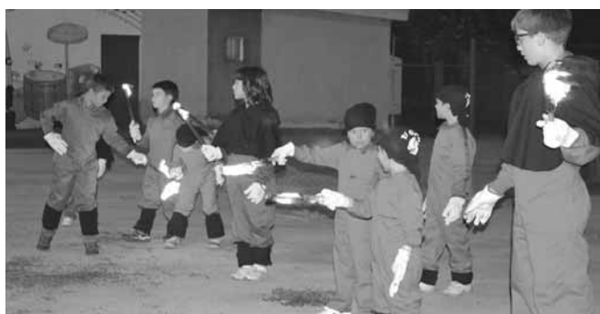
Els Diablons del Griu