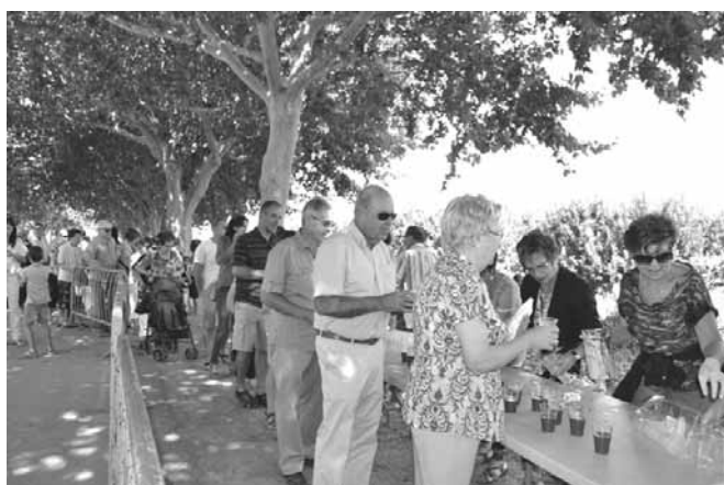
Repartimet de xocolata i coca

Al vespre, a 2/4 de 10 a la pista poliesportiva, va tenir lloc una sessió de ball amb el GRUP ATLANTIS. Hi va haver servei de bar amb begudes i entrepans freds i calents.