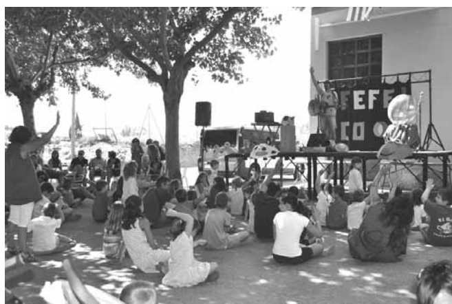
Espectacle d'animació infantil