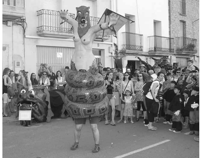
La Pàjara de Terrassa,

Un any més hem realitzat la tradicional Trobada de Bestiari i el Festival d'Enceses d'Artesa de Lleida, que no és per presumir, però només el fem a la nostra població amb un gran èxit de participació de colles i públic que ens visiten de fora vila i podem afirmar, per les mostres d'agraïment i reconeixement, especialment de les colles participants, que creiem que estem fent història, any rere any, en el món del bestiari i el que això comporta per a la cultura