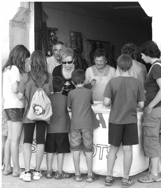
Tómbola del grup local de Càrites

Durant tots els dies el grup de "Càritas" d'Artesa de Lleida va organitzar la seva tómbola a la casa Parroquial