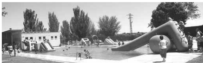
Jocs aquàtics a les piscines

De 2/4 de 12 fins a les 2 del migdia i de 2/4 de 5 fins a les 7 de la tarda, a les piscines municipals hi