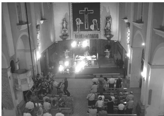
Participació de la Coral la Primavera a la Missa Major

A les 12 del migdia es va oficiar MISSA MAJOR, cantada per la coral LA PRIMAVERA D'ARTESA DE LLEIDA. En acabar la Santa Missa la coral va fer un petit concert.