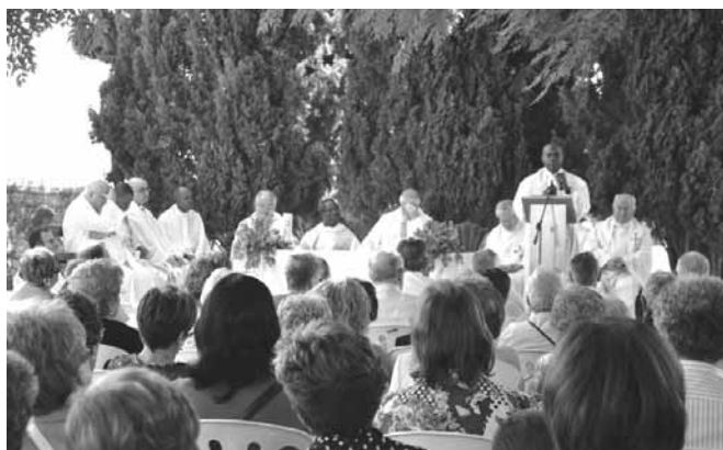
Missa a l'ermita de sant Ramon