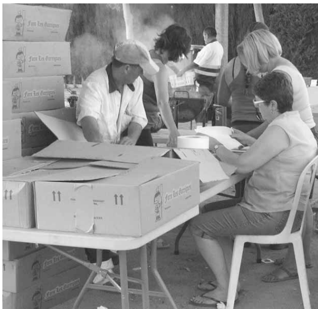
Preparació d'entrepans pel sopar de germanor