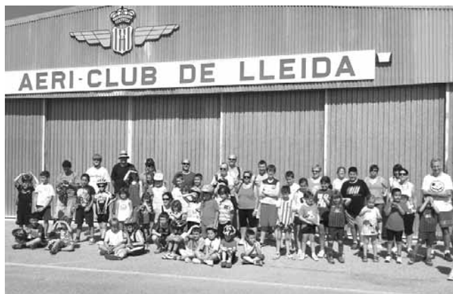
Els participant en un dels recorreguts vam arribar fins l'aeròdrom d'Alfés

A les 10 del matí, organitzada per l'AMPA del col·legi "Els Til·lers", es va iniciar una BICICLETADA, amb concentració al passeig de Sant Ramon, i amb diferents recorreguts pensats per les diferents edats