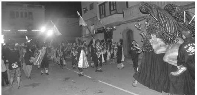
Entrada del Griu a la Plaça Major