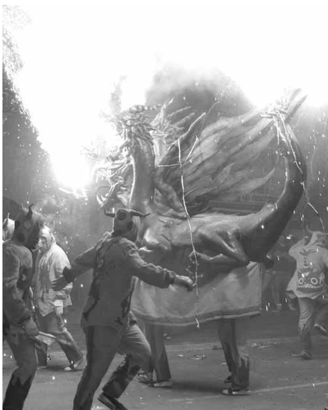
Actuació del Badalot de l'Arboç , guanyador del concurs