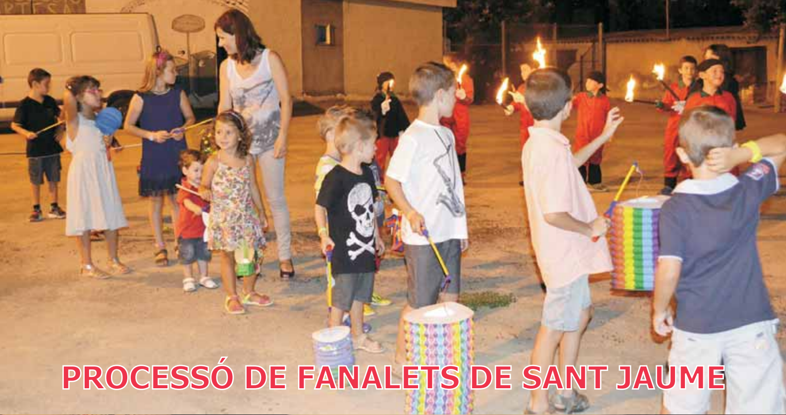
PROCESSÓ DE FANALETs DE SANT JAUME

Revista d'opinió i informació local. ARTESA DE LLEIDA