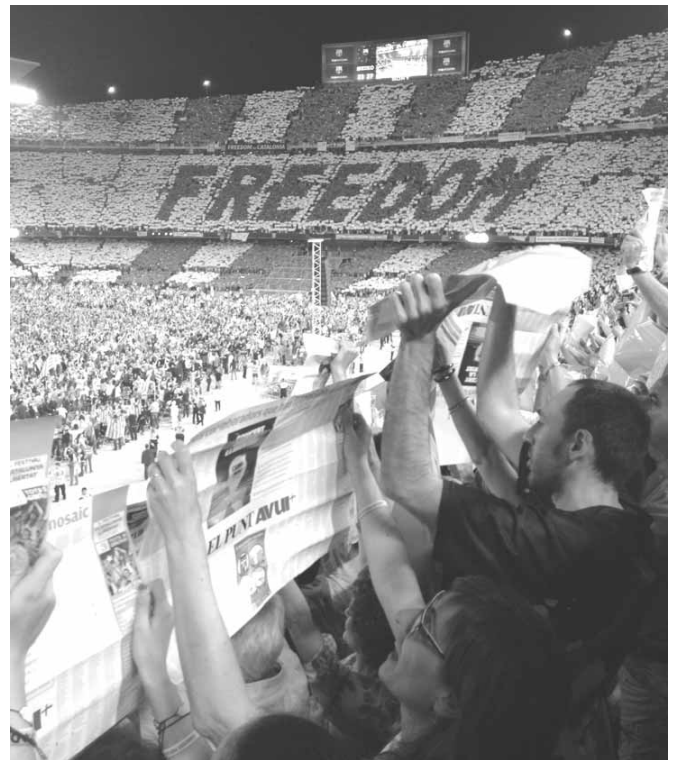
Aspecte de l'estdi en el moment del mosaic