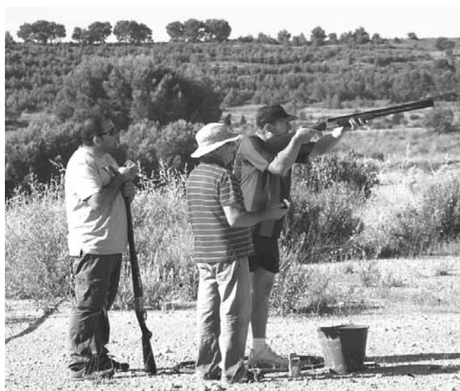
Concurs de tir al plat

A 2/4 de 7 de la tarda, es va iniciar la TROBADA DE BESTIAR POPULARI FESTIU DE CATALUNYA, acte del qual us en parlem en una altra secció de la revista.