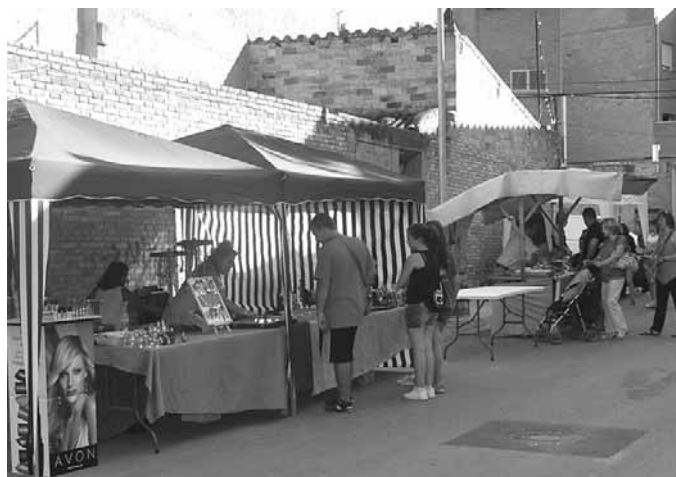
Paradetes al carrer Primavera

A les 9 del vespre una llarga sessió de ball amb l'orquestra "VENUS" a la Pista Poliesportiva posava el punt final a la festa.