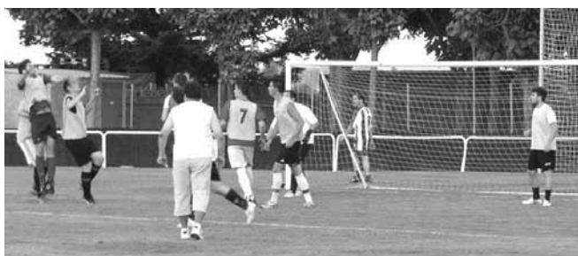
Un dels partits del torneig de futbol

A les 9 del vespre, al camp de futbol va tenir lloc un torneig triangular entre veterans, amateurs i juvenils.