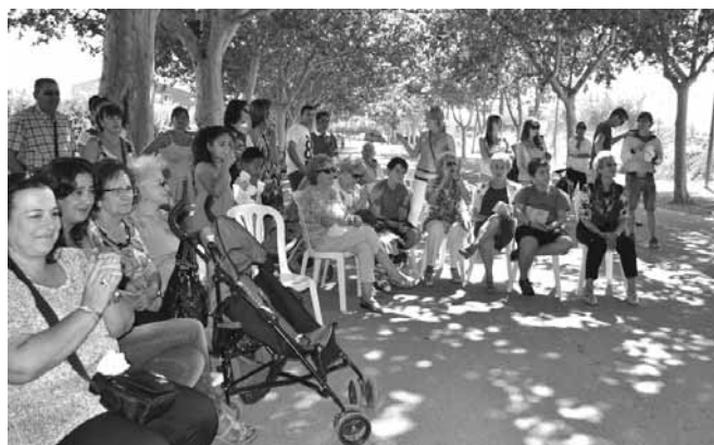
Espectacle d'animació infantil