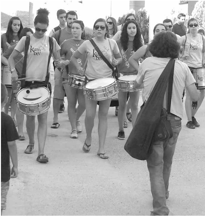
Grup de percusió

REPUBLICA SKA va fer l'escalfament musical i a continuació es va celebrar un correfoc a càrrec del diables de Junda, que van donar pas a les enceses. Descripció de les enceses: