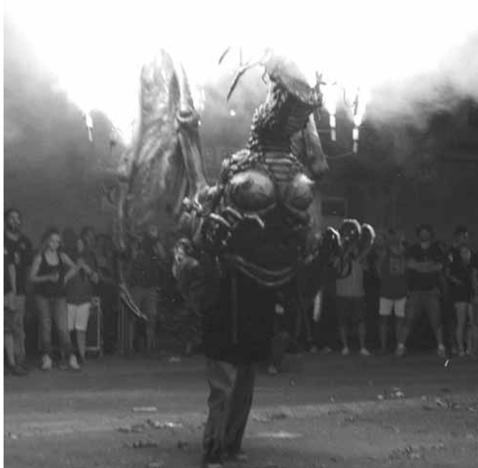
Actuació de la Víbria Jove d'Igualada

FLABIOLARIES DE L'ESCOLA ELS TIL·LERS i del grup LA QUARTANA . En la segona intervenció de l'amfitrió, vam poder estrenar la música i ball protocol·lari que correspon aquest tipus de carcasses