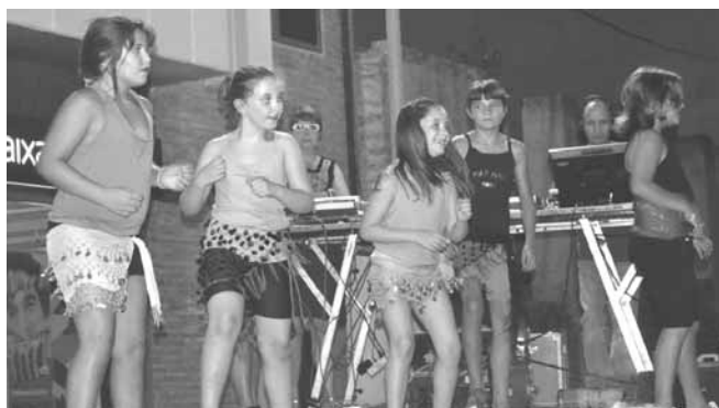
Actuació d'un grup de nenes