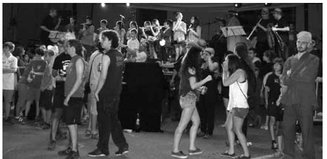
Actua ació dels flabiolaires de l'escola "Els Til·lers i el Grup Quartana

La tercera novetat va a anar a càrrec dels