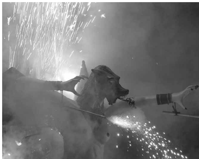
Actuació de la Pàjara de Terrassa

El festival va finalitzar amb un espectacular castell de focs i amb la votació del jurat.