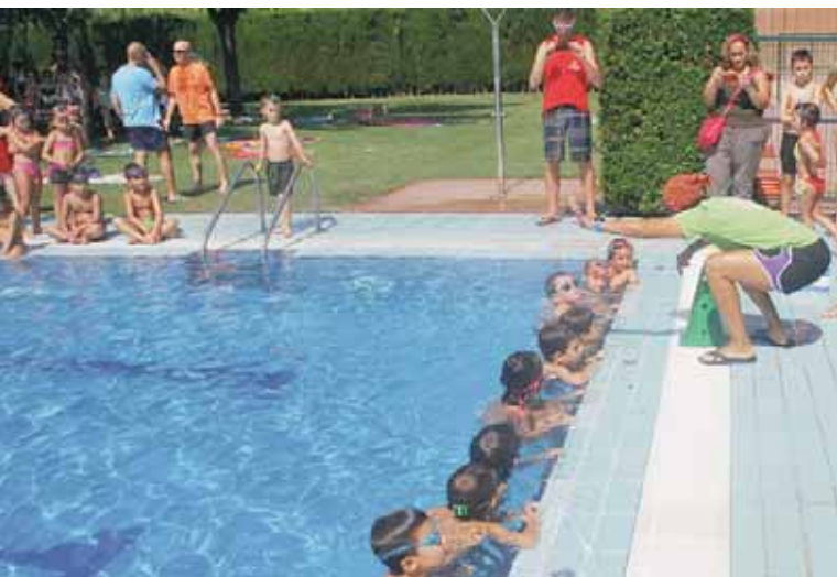
FI DE CURS DELS CURSETS DE NATACIÓ