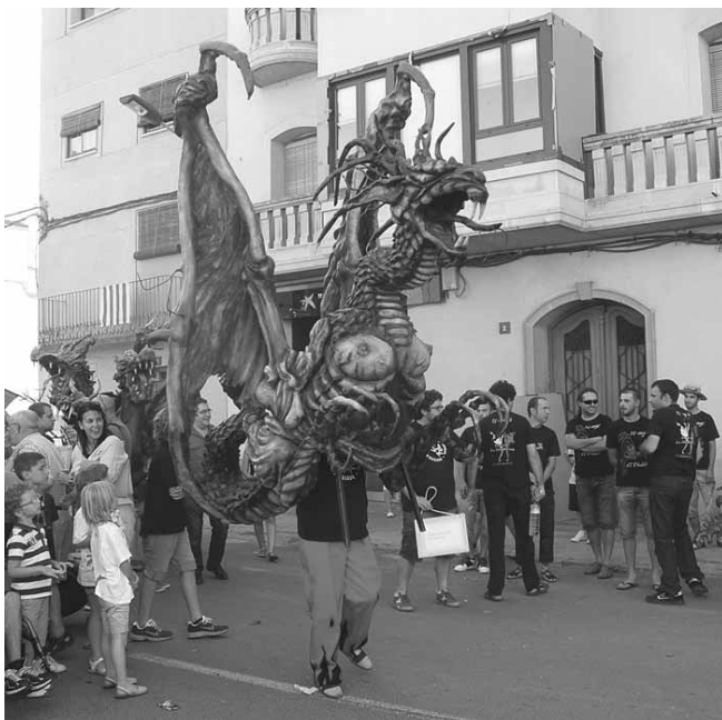
La Víbria Jove d'Igualada