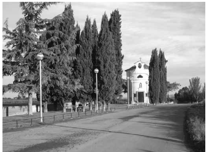
Ermita de Sant Ramon

I com que és un espai singular, l'hem aprofitat per festes, trobades, curses, cassoles, processons,