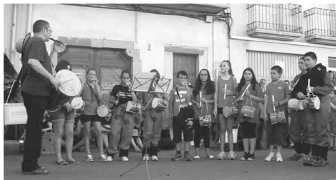
Els flabiolaires de l'escola Els Til·lers

La festa es va iniciar a 1/4 de 7 de la tarda, amb la plantada de les bèsties a la Plaça Major. A les 7 de la tarda es va donar la benvinguda a totes les colles i van actuar els Flabiolaires de l'Escola els Til·lers d'Artesa de Lleida , i tot seguit va tenir lloc la mostra de balls del bestiar , que és una ballada individual de lluïment.