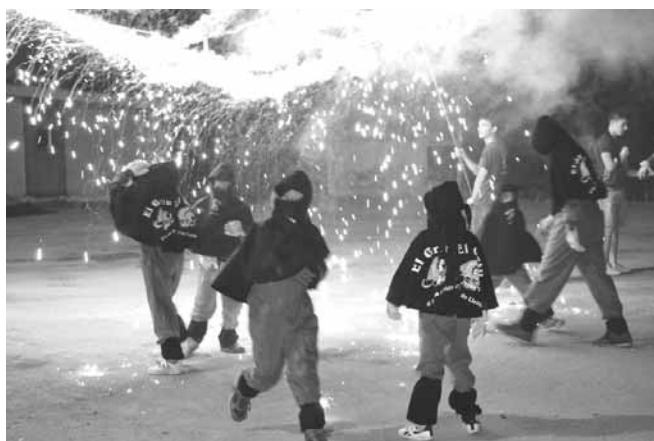
Actuació dels Diablons del Griu