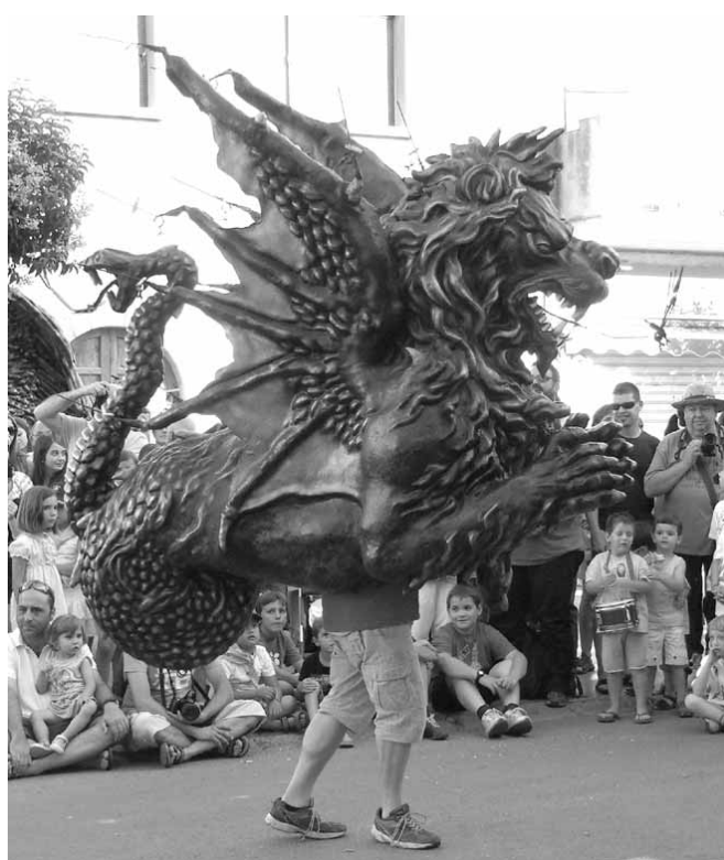
La Godra de Caldes de Montbui

tradicional catalana. És per això que donem les gràcies a tothom que ho fa possible des de l'infant més petit que participa amb la colla del griu, fins als que desmunten l'escenari al final de la festa, a tots ells moltes gràcies.