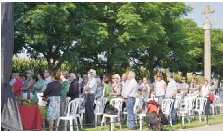
FESTA DE SANT RAMON