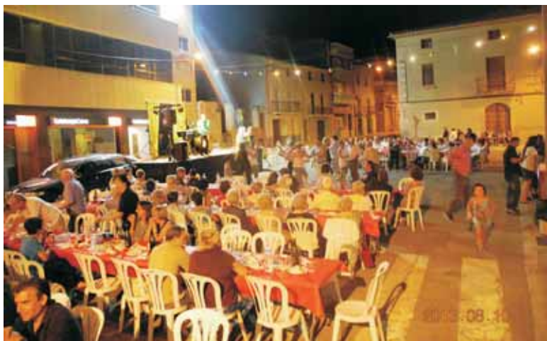
FESTA PERQUÈ VOLEM!