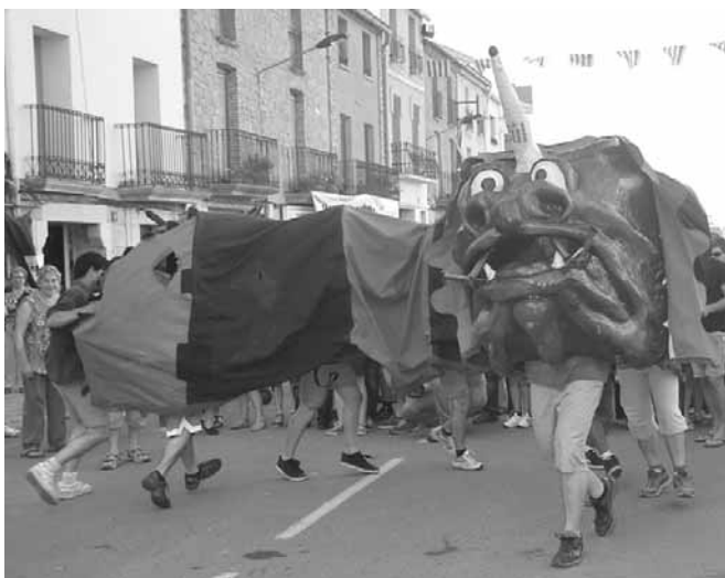
La Cuca de Castellbisbal