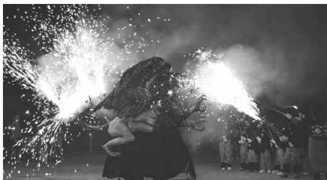
Actuació del Griu