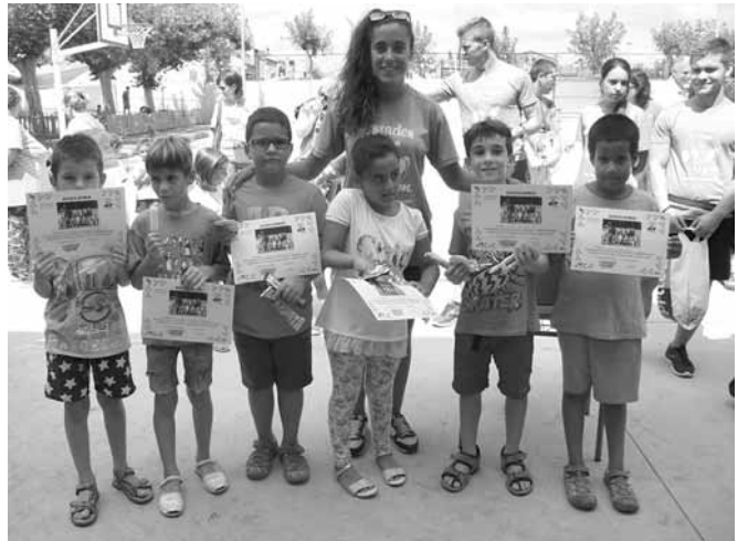
Participants al curs d'aprenentatge 2

que no en permetien la celebració. Però els nens i nenes no es van quedar sense festa, aquesta es va traslladar al recinte de les escoles, on es van improvisar diferents jocs i activitats.