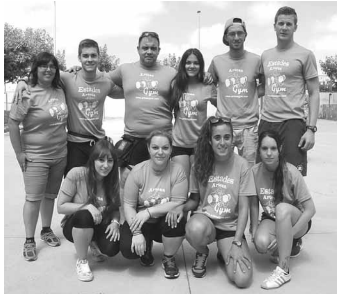
Monitors / es i responsables del gimnàs