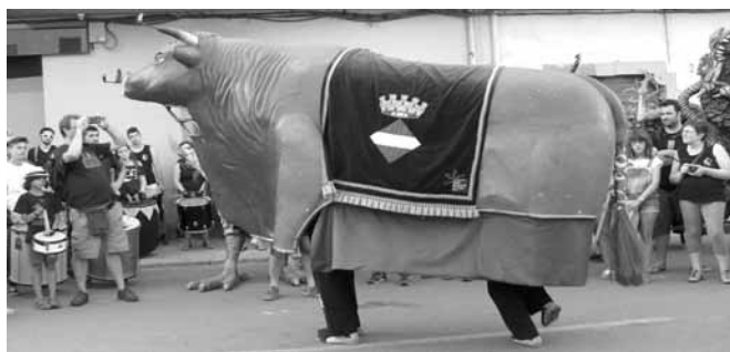
Bou Tradicional de Valls