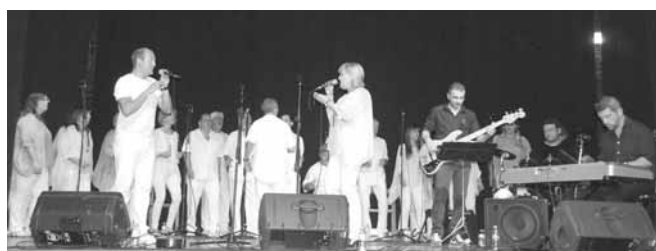
Actuació del grup Tons i Sons

A les 7 de la matinada.- XARANGA, pels carrers del poble a càrrec dels HELVÉTICOS.