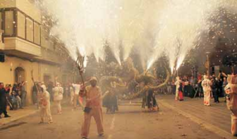
L'HYDRACUS GUANYADOR DEL FESTIVAL D'ENCESES