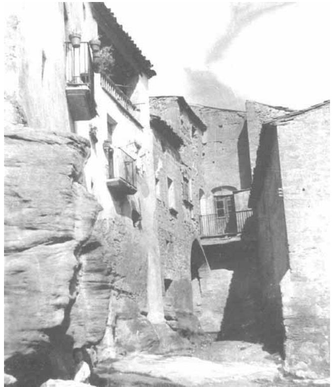
El Perxi i les façanes posteriors de les cases del costat est de la Vileta

Jo conservo els meus propis records de la Vileta i, per això, veig la Vileta a la meua manera. Penso que, segurament, hi ha tantes VILETES com artesencs que en conservin algun record.