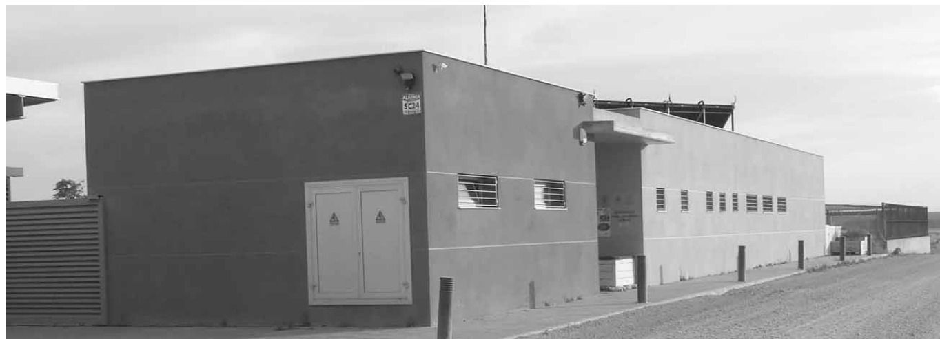
Centre d'Atenció d'Animals de Companyia a Alcanó

2- Treballar i vetllar, conjuntament amb el Consell comarcal i els diferents Ajuntaments del Segrià pel bon funcionament del CAAC Segrià (Centre d'Atenció d'Animals de Companyia) per tal que pugui acollir dignament els animals