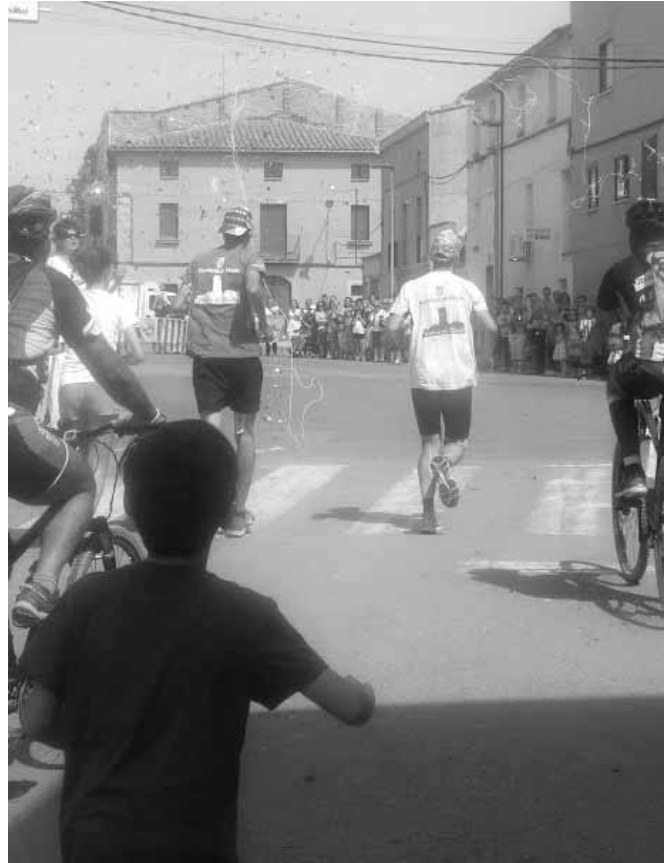
Arribada a la meta