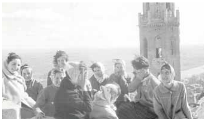
A la Suda