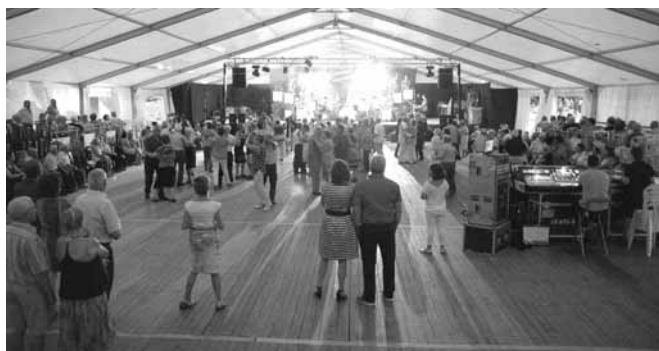
Actuació de l'orquestra Maravella

Des de 2/4 de 12 del matí fins a les 2 del migdia, i de 2/4 de 5 de la tarda fins les 7.- JOCS AQUÀTICS, al recinte de les piscines municipals.