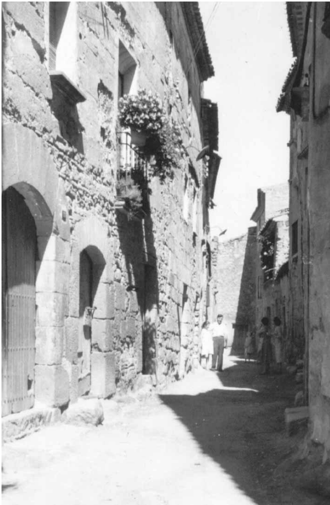
Extrem nord de la Vileta amb el Perxi a la dreta

gran amb roques tombades i altres amagatalls que ens servien molt bé (a la canalla de llavors) pels nostres joc. L'Abadia ocupava el lloc on, avui, hi ha els Casal del Jubilats. Entre l'espai que ocupava