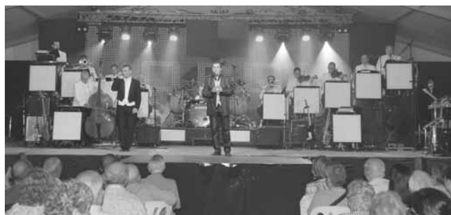
Concert de l'orquestra Maravella

També a les 9 del vespre.- 4a MARTINADA POPULAR I SOPAR POPULAR DEL JOVENT, organitzada per l'Associació de Joves d'Artesa, i que va consistir en un sopar a la Plaça de les Albízie.