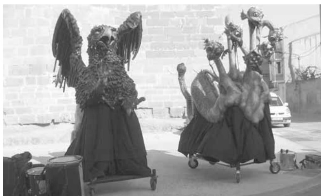
El Griu i l'Hydra, les dues bèsties d'Artesa

sala del Teatre Municipal va tenir lloc l'actuació musical a càrrec del grup TONS I SONS, grup finalista del concurs de TV3 Oh Happy Day. De les 9 a les 10 del vespre.- BALL, a l'envelat, sessió a càrrec del conjunt ACUARIO. A les 12 de la nit i fins a les dues de la matinada.- BALL, a l'envelat a càrrec dle grup ACUARIO A 1/4 d'12 de la nit.- ESCALFAMENT musical previ al festival d'enceses, a càrrec de GRUP BRUIXA EXPRES, a la plaça Major.