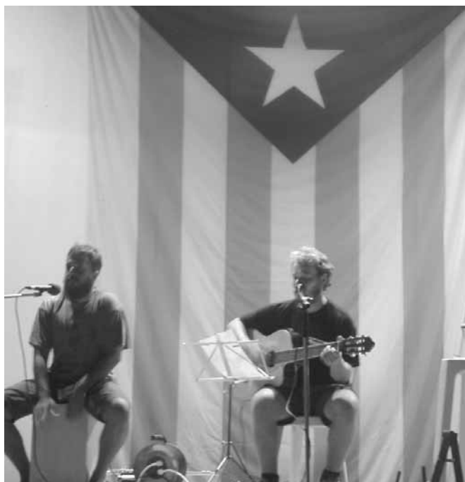
Actuació de Lo Martí de Tèrmens