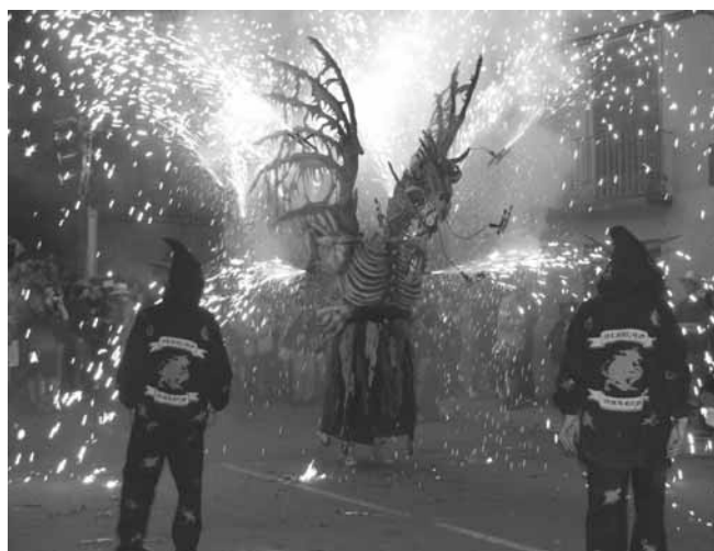
La Bèstia de Parets del Vallès.

Foc i Forca, dragonets bessons de les Forques de Can Deu de Sabadell, el Drac petit de Valls i els Dracs Bessons de Castelló. Tot amenitzat amb la percussió de Fes-tam tam i Kumbeya. Un cop passada la trobada de bestiar, la festa de bateig i el sopar de convit i germanor, a les 11 de la nit, es va continuar la festa a càrrec del grup Bruixa Express per anar escalfant la gent i l'ambient. A dos quarts de 12 de la nit va començar el 7è Festival d'Enceses del Bestiari de Catalunya amb l'apagada de les llums i l'aparició i encesa en la seva primera sortida de nit de l'Hydra d'Artesa de Lleida.