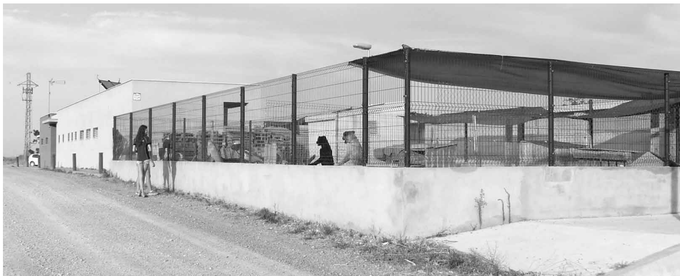
Centre d'Atenció d'Animals de Companyia a Alcanó

perduts o abandonats a la comarca i que ha estat creat per a aquesta finalitat amb diner públic . 3- Treballar i Vetllar, conjuntament amb l'Ajuntament de Lleida, pel bon funcionament del CAAC Lleida i recolzar la feina que han endegat les Associacions: Amics dels Animals del Segrià, CIPAC i el CAAC Segrià dels quals reben suport i informació. 4- Vetllar perquè es compleixi la normativa municipal de cens i xipatge dels animals de companyia. 5- Vetllar perquè cada municipi disposi d' Ordenança municipal d'animals de companyia 6- Augmentar la consciència ciutadana pel que fa a la tinença responsable. 7- Ens proposem no sols vetllar pel compliment de la llei, sinó també donar a conèixer i denunciar, si és el cas , els casos d'incompliment.