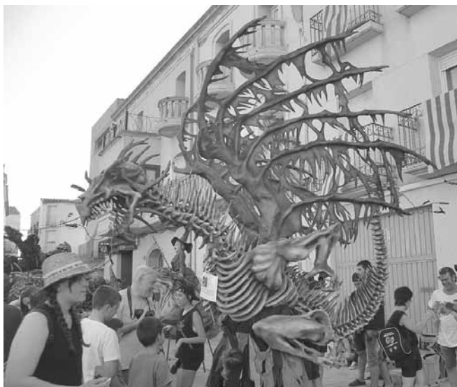
Bèstia de Parets del Vallès

A les 7 de la tarda amb la música dels Flabiolaires de l'Escola els Til·lers i el grup La Quartana les