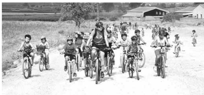
Bicicletada al Tossal del Poble