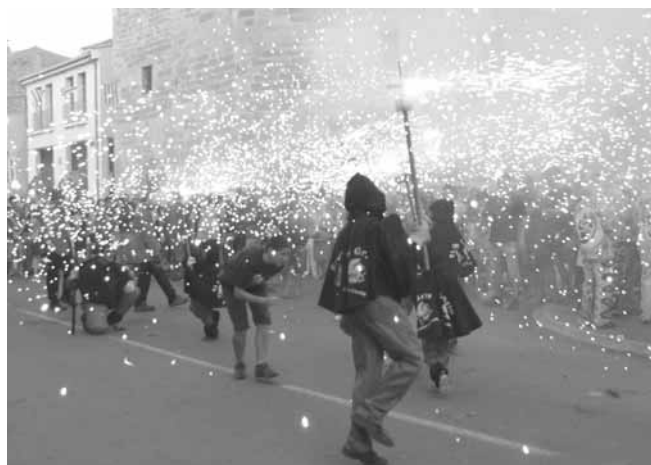
Correfocs dels Diablons