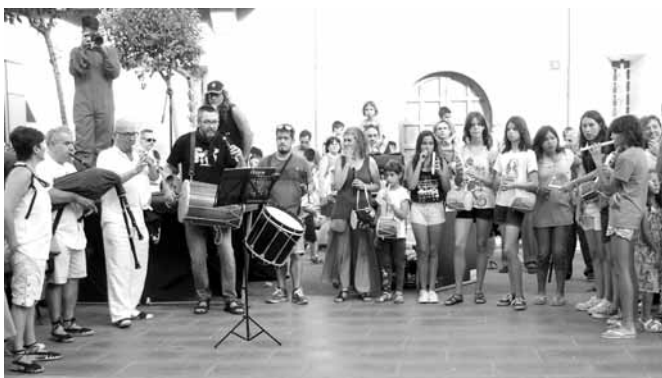
El Grup Quartana i elsfabiolaies dels Til·lers