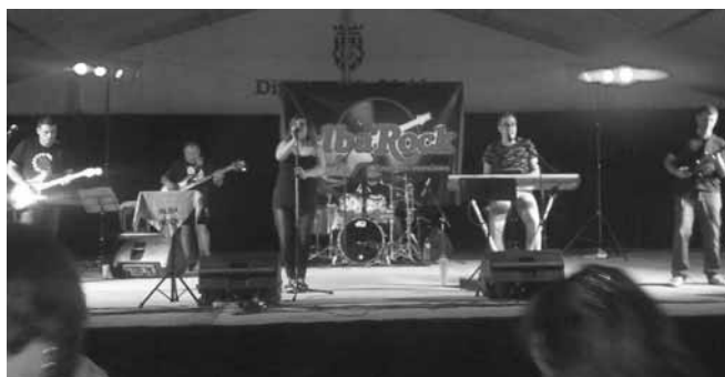
Actuació del grup Alba Rock

entre juvenils, amateurs i veterans, però no es van celebrar per desajustaments en l'organització. A 2/4 de 9 del vespre.- CERCAVILA DISNEY, pels carrers del poble. Amb sortida i arribada des de l'envelat.