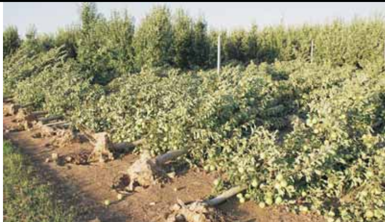
CONSEQÜÈNCIES DE LA TEMPESTA DEL 31 DE JULIOL