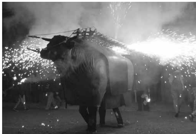
Bou Tradicional de Valls

A continuació la colla de diables de Juneda, els Rojos de Junda, comença el correfoc que porta el foc a la plaça i esvera les bèsties que es preparen per la primera encesa del concurs.