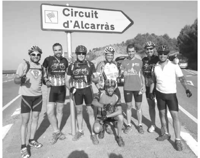
El Marcel amb membres del Superbé que el van acompanyar en la tercera etapa