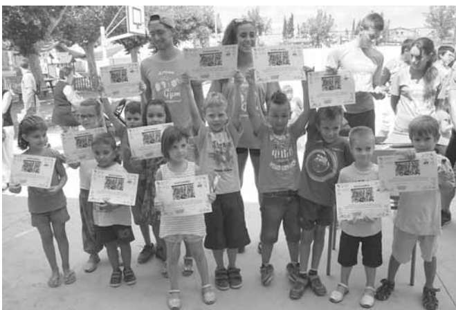
Participants al curs d'iniciació 2