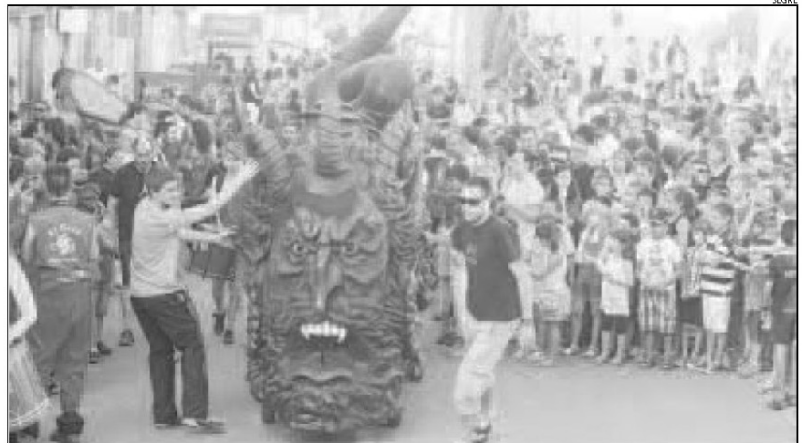
Set colles participaran a la Trobada de Bestiari Popular i Festiu i a les posteriors enceses.

versions de Contraband i la DJ Blanca Ross, la Matinada i sopar, la Bruixa Express i Xeic!. I convida els televisius Tons i Sons, del concurs Oh Happy Day , de TV3. Sardanes, revetlles, vermuts o misses arrodoneixen el programa, en què tot és de franc.