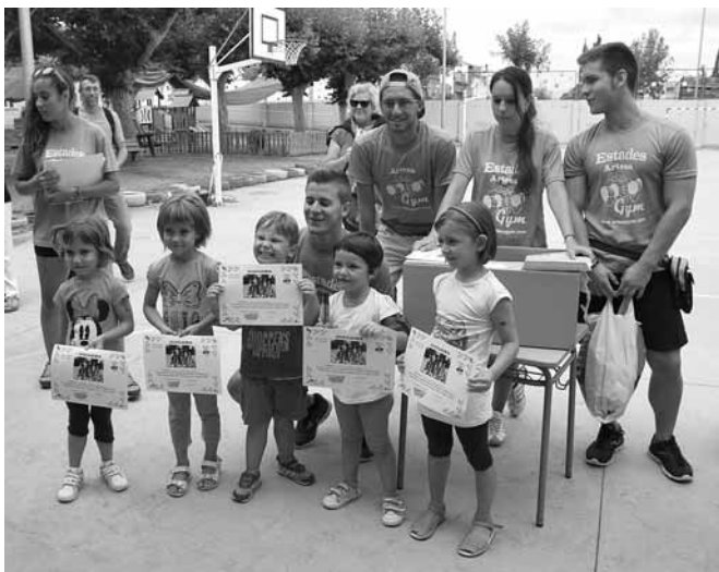
Participants al curs d'iniciació 1