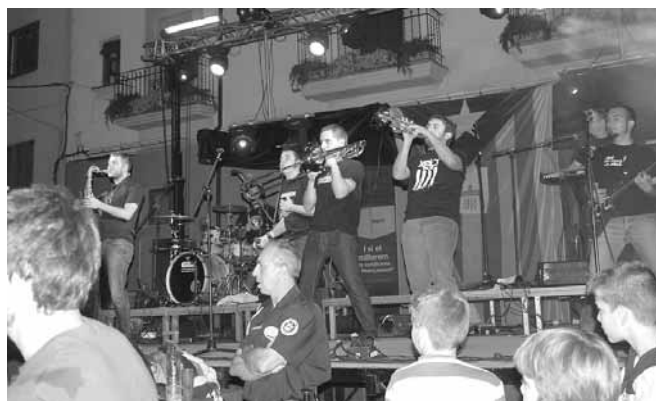
Actuació del conjunt XEIC