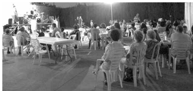
Actuació dels alumnes de les estades musicals