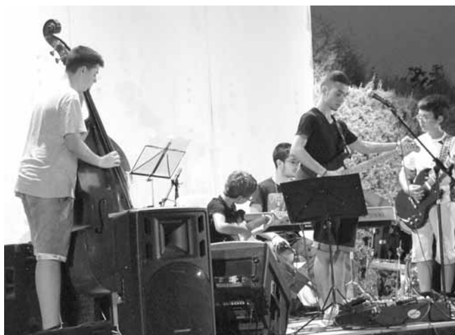
Actuació dels alumnes de les estades musicals