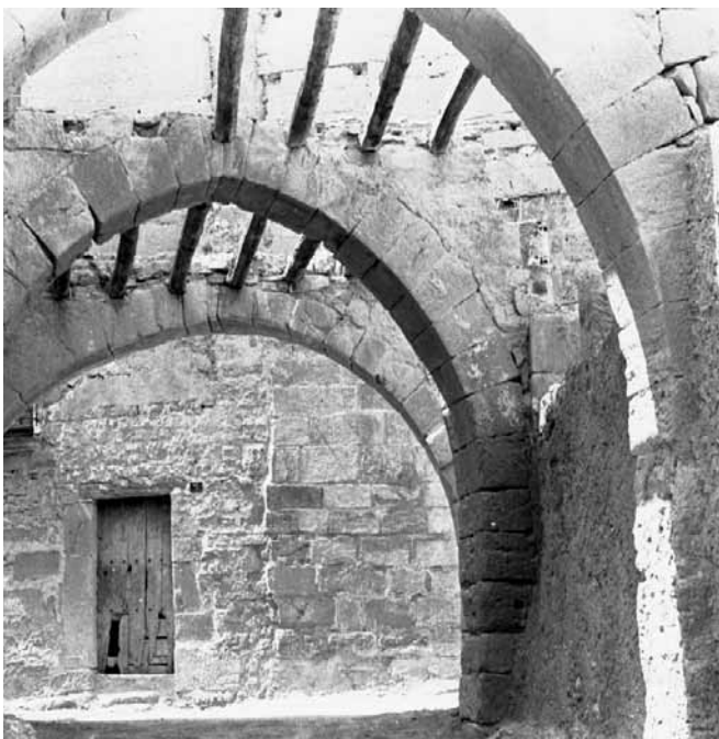
Els arcs del Perxi encara drets