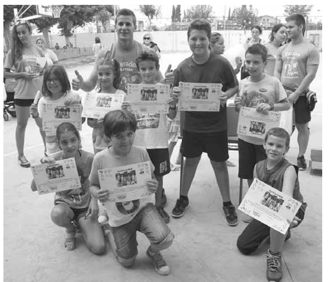
Participants al curs de perfeccionament 1