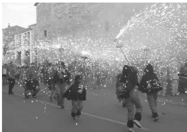
Els Diablons del Griu

A 2/4 de 12 de la nit.- FESTIVAL D'ENCESES de foc, a la plaça Major. Per la importància d'aquest acte, us en parlarem en una altra secció de la revista.