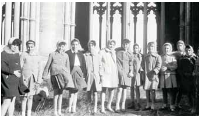
Al claustre de la Seu Vella