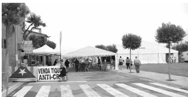
L'envelat de la Festa Major

Un any més, el primer cap de setmana del mes de juliol, es va celebrar la Festa Major del nostre poble. En aquesta ocasió els actes es van iniciar el dijous 2 de juliol i es van acabar el diumenge dia 5. La principal novetat de la Festa Major d'enguany fou el canvi d'ubicació de l'envelat, un envelat més petit de l'habitual, i de les firetes, degut a les obres que es realitzen a la pista poliesportiva per la