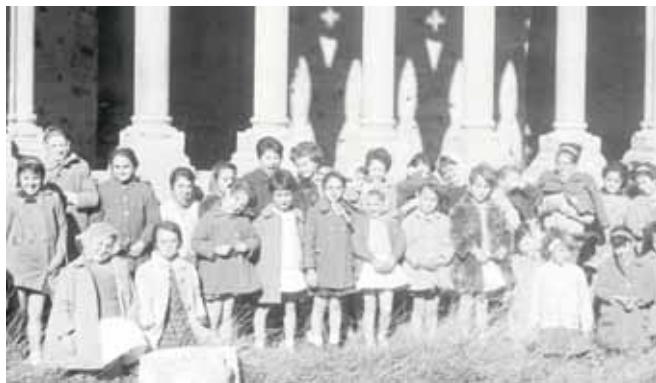
Al claustre de la Seu Vella