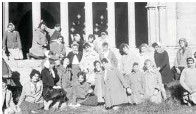
Al claustre de la Seu Vella