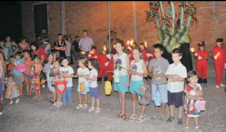
FANALETES DE SANT JAUME