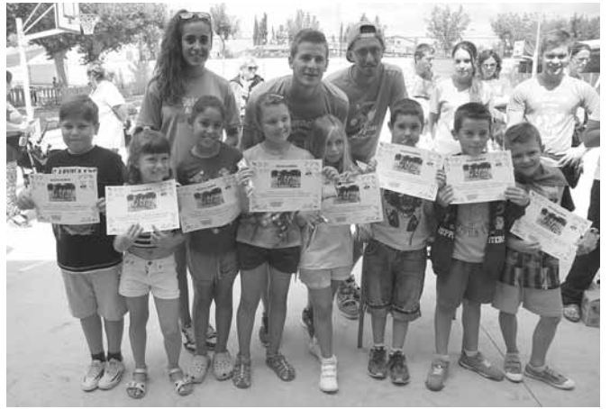
Participants al curs d'aprenentatge 1

L'últim dia del curset, el dissabte 1 d'agost, havia de tenir lloc la festa de cloenda dels cursets i les estades al recinte de les piscines, com és tradicional, però la forta tempesta caiguda el dia 31 de juliol, va deixar el recinte de les piscines en unes condicions