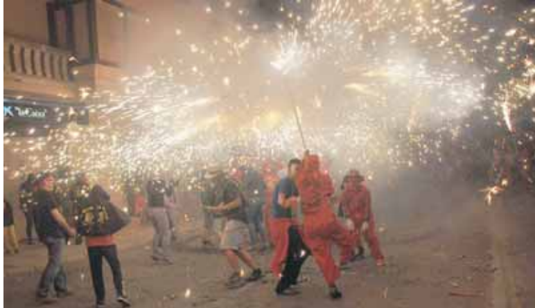
CORREFOCS DELS ROJOS DE JUNDA