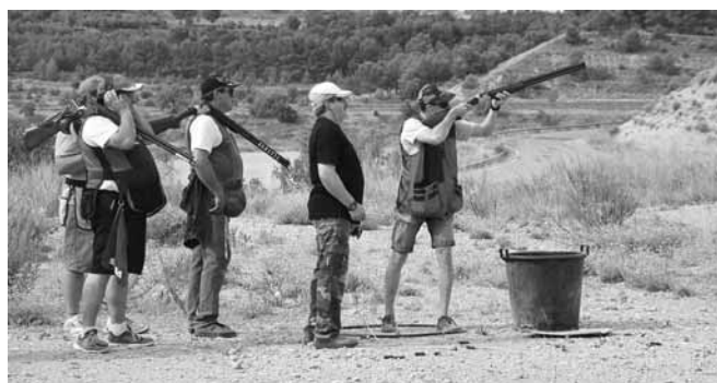
Tir al plat

A les 11 del matí.- JOCS DE FUSTA, al passeig de Sant Ramon, a càrrec de la companyia ARRANCACEBES.