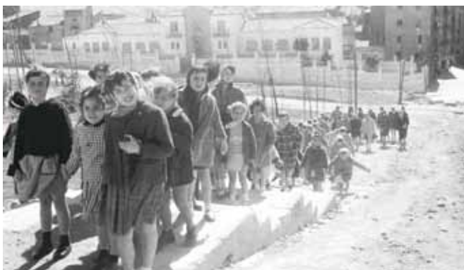
Pujada cap a la Seu Vella