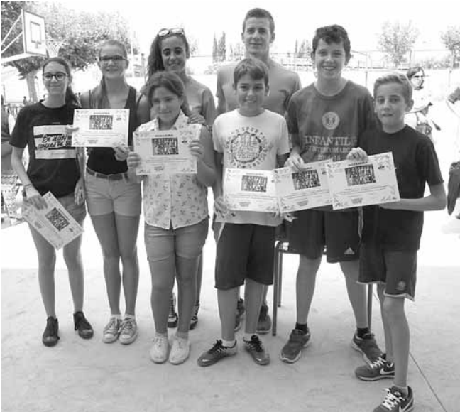
Participants al curs de perfeccionament 2