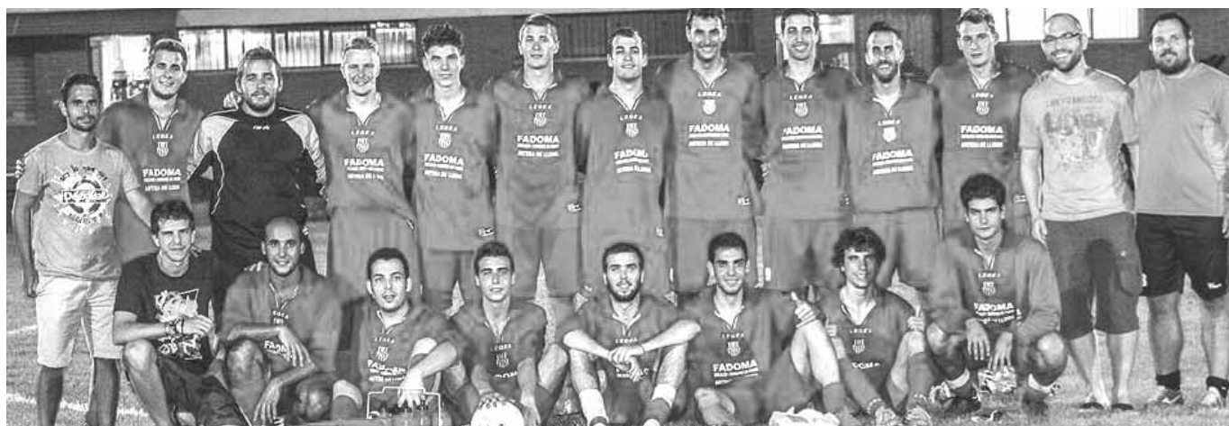
Components de l'equip de futbol