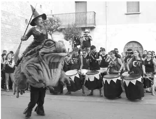
Gripau de les Bruixes del Nord de Sabadell

bèsties van mostrar els seus balls per adaptar-se a l'ambient de la plaça i fer una bona actuació cremant fort a la nit.