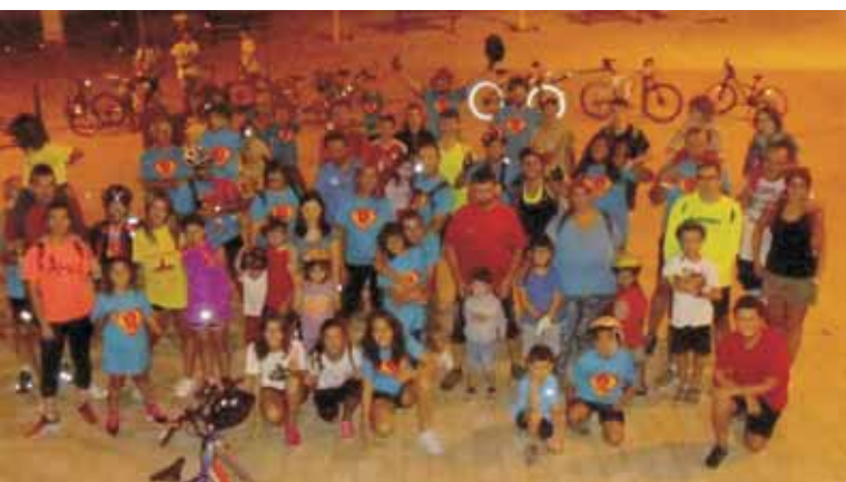
SORTIDA DELS SUPERBÉ