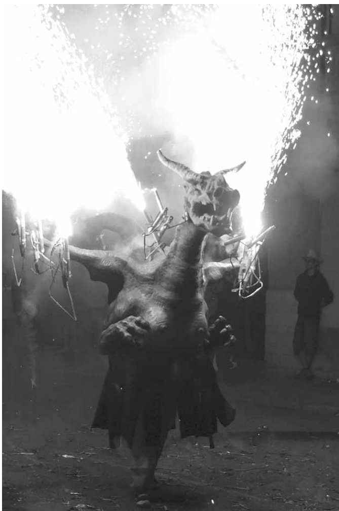
Actuació de la Víbria