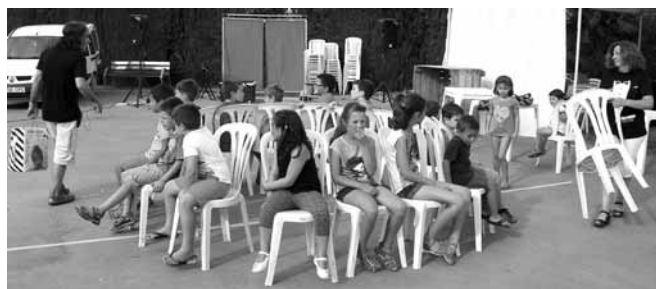
Festa dels nens. Joc de les cadires