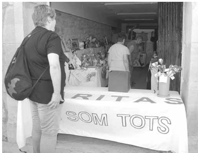
Tómbola del grup Càritas d'Artesa

Durant tots els dies el grup de "Càritas" d'Artesa de Lleida va organitzar la seva tómbola a la casa parroquial.