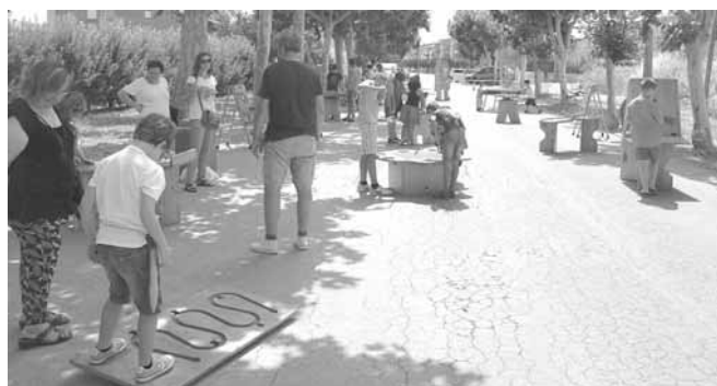
Jocs de fusta

A les 2 del migdia.- VERMUT POPULAR, al passeig de Sant Ramon, en acabar la ballada de sardanes es va oferir un vermut a tots els assistents. A 2/4 de 7 de la tarda.- TROBADA DE BESTIARI