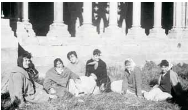
Al claustre de la Seu Vella