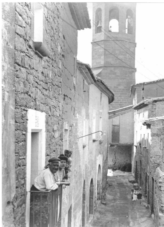
Vista de la part sud de la Vileta de 1906, en la en el fons i a la dreta es pot veure la casa rectoral

Aquest rector de la cobla vivia a la casa rectoral (amb l'entrada per la Vileta) de la qual tothom en deia l'Abadia. L'Abadia era un edifici que es va enrunar el dilluns 16 de desembre de 1918, cap a les set del matí, segons s'explica a l'edició de dimecres 18 de desembre del Diario de Lérida . Enrunada l'Abadia, al seu lloc hi va quedar un espai