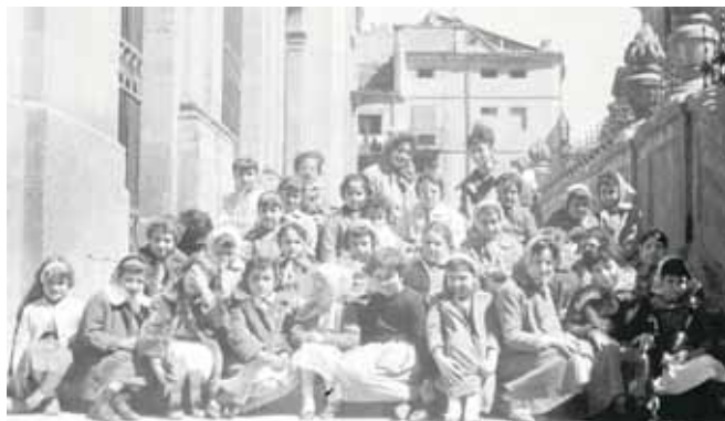
Fotos a les escales de la catedral Nova