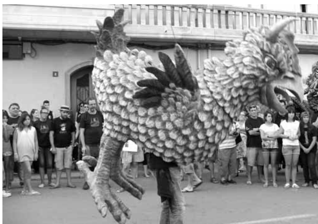
Poll Foll de Ripollet