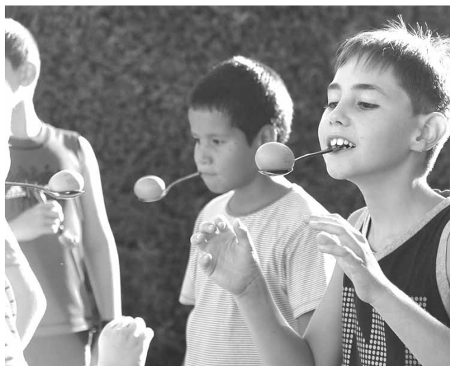
Festa dels nens. Joc de l'ou