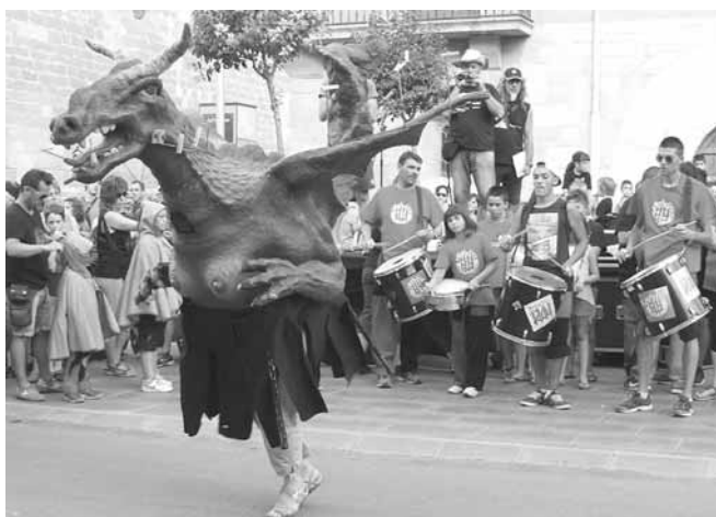
Víbria de Castelló