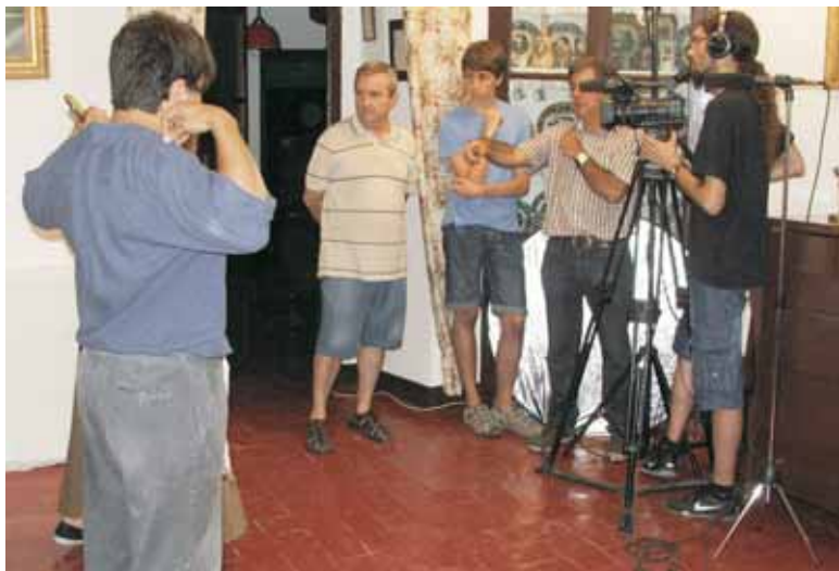
RODATGE D'UN CURTMETRATGE-DOCUMENTAL