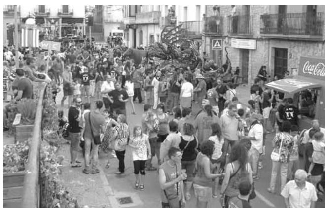
Trobada de Bestiari Popular i Festiu

A 2/4 de 8 de la tarda.- CONCERT CORAL, a la