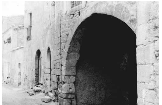
El Perxi i les portes de cal Miró i al seu costat la de cal Gepa

Quan va caure el primer arc del Perxi del Miró (a l'entorn de 1971 o 72) des de l'Agrupació Cultural La Femosa vam iniciar una campanya per mirar de protegir el Perxi de la manera que fos. Una de les coses era fer (de fer la vam fer) una enganxina per posar als cotxes. En aquells anys s'havia posat de moda enganxar-hi eslògans reivindicatius o de propaganda de pobles. A La Femosa vam fer un concurs per triar l'eslògan més escaient. Cada persona en podia portar fins a un màxim de tres,