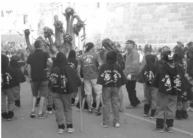
Els Diablons amb l'Hydra

Seguidament per indicar que seria un dia de foc i festa, la colla dels Diablons del Griu d'Artesa de Lleida, van cremar pólvora durant una estona, incitant també d'aquesta manera que la seva bèstia, l'Hydra d'Artesa de Lleida, despertés per primer cop. I així va ser, com es va realitzar el Convit de Foc al Bateig de l'Hydra d'Artesa de Lleida, una bèstia infantil amb 6 caps de drac davant i un cap de Griu a la cua, fent referència al Griu d'Artesa de Lleida,