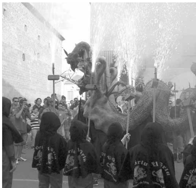
Bateig de foc de l'Hydra

El bateig va anar acompanyat dels seus guardians, la colla de Diablons d'Artesa de Lleida, i d'altres bèsties infantils com en Rusti de Parets del Vallès,