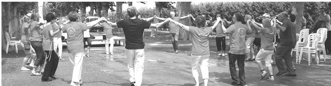
Sardanes al passeig de Sant Ramon

popular i festiu de Catalunya. Per la importància d'aquest acte, us en parlarem en una altra secció de la revista.