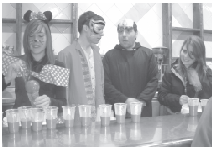
Disfresses de Carnaval