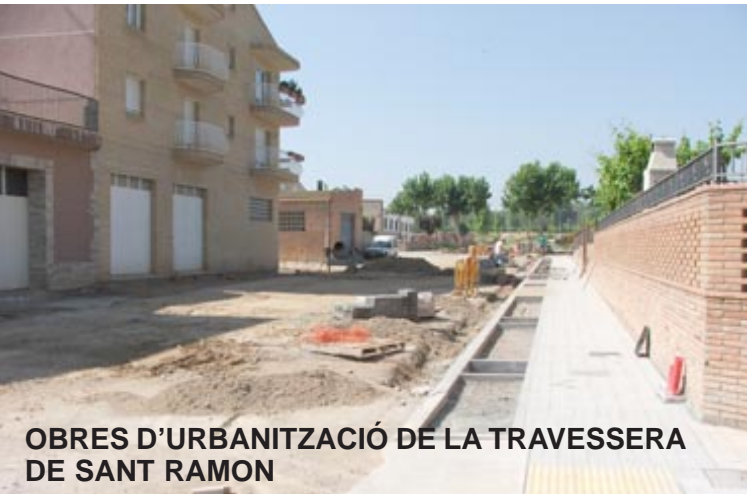
OBRES D'URBANITZACIÓ DE LA TRAVESSERA DE SANT RAMON