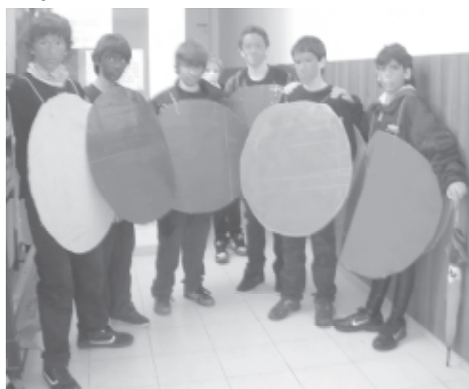
Disfresses de Carnaval