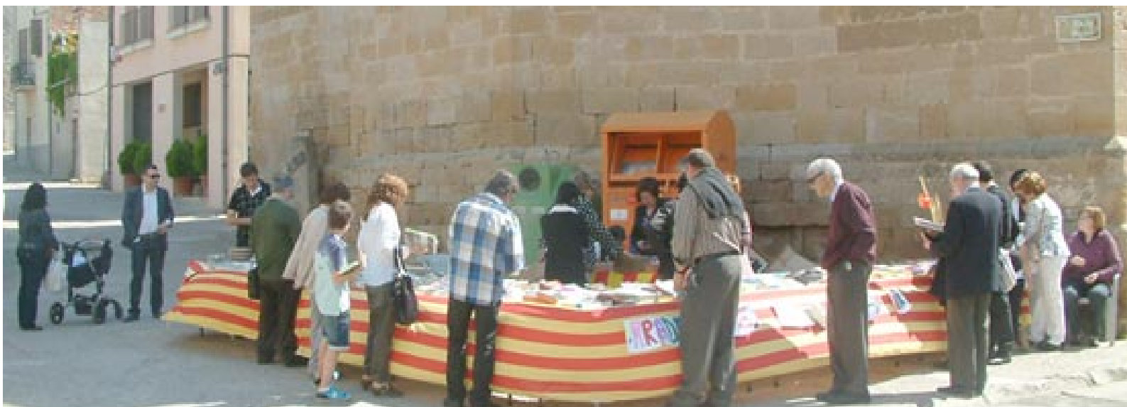
PARADA DE LLIBRES DE LA DIADA DE SANT JORDI DE L'AGRUPACIÓ CULTURAL LA FEMOSA