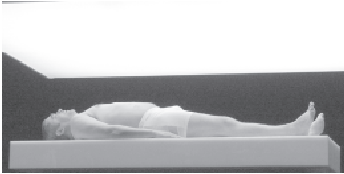
L'actor Pere Arquillué en un moment de la representació de l'obra Primer amor