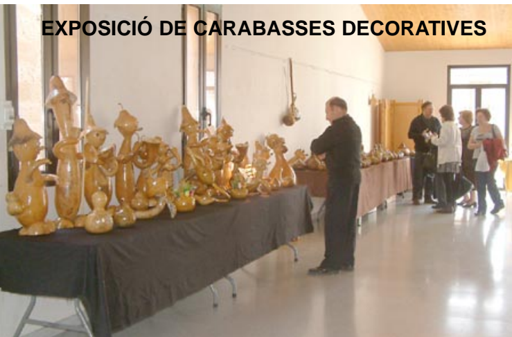
EXPOSICIÓ DE CARABASSES DECORATIVES