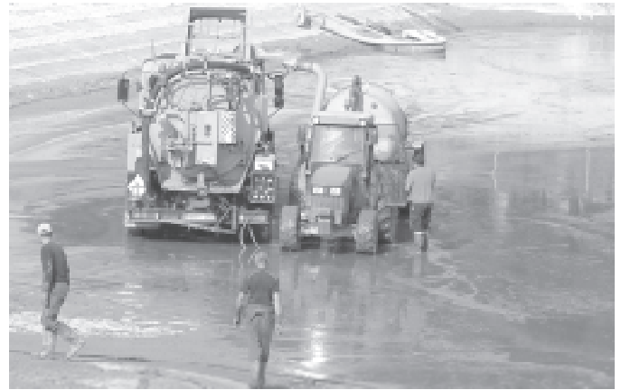
Neteja dels dipòsits municipals d'aigua