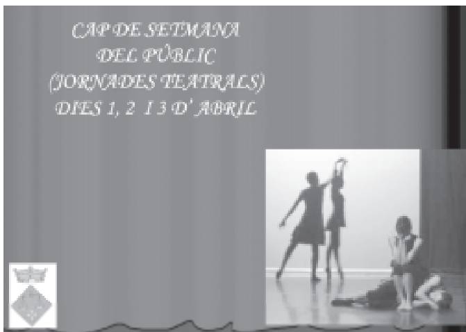
Tríptic del Cap de Setmana del Públic