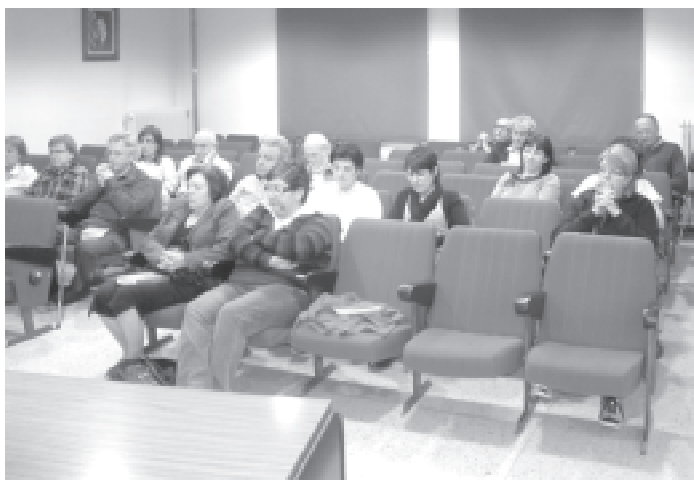
Públic assistent a la presentació del llibre La plana salvatge