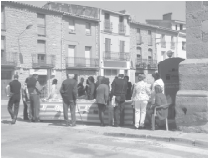
Parada de llibres de la Diada de Sant Jordi de l'Agrupació Cultural La Femosa