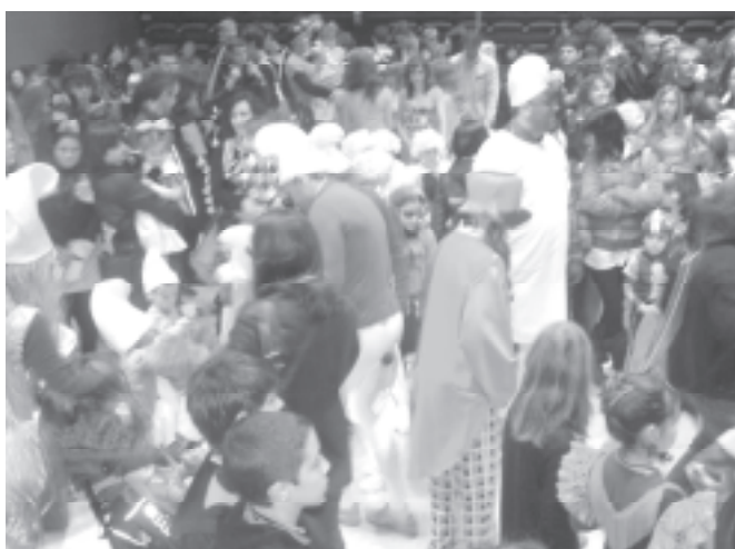
Ball de Carnaval