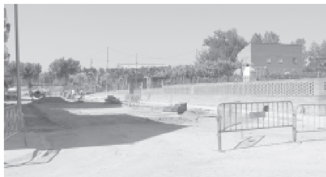
Obres d'urbanització de la Travessera de Sant Ramon