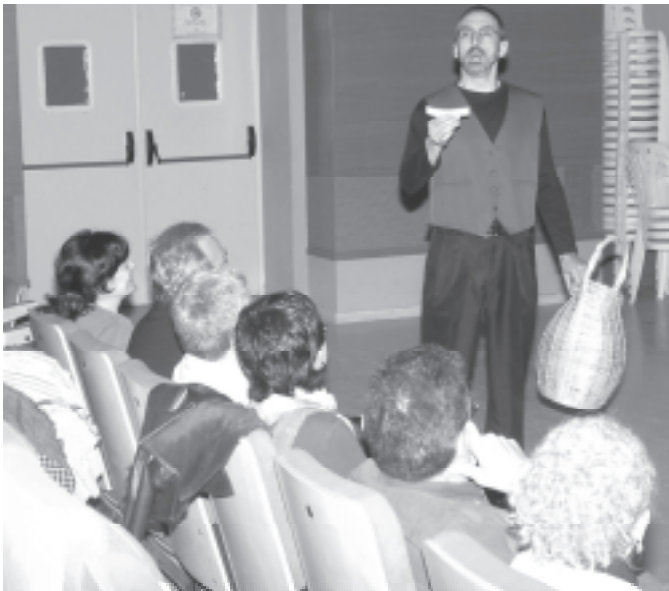
Representació de l'obra Xerraries per la companyia CAET (Centre d'Arts Escèniques de Terrassa), en la que el públic va tenir un paper fonamental