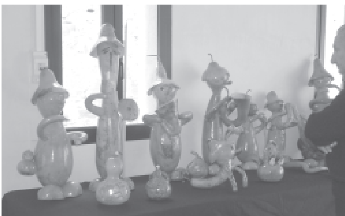
Exposició de carabasses decoratives