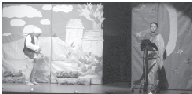
Representació de La lluna nova per la companyia local Els Xants