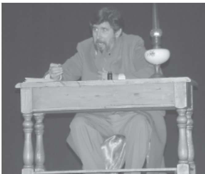
Representació de l'obra Diari d'un boig de N. Gogol