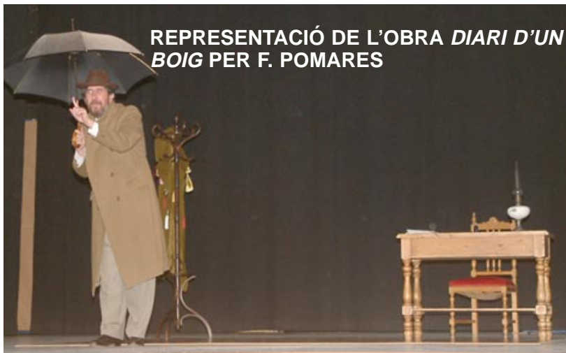
REPRESENTACIÓ DE L'OBRA DIARI D'UN BOIG PER F. POMARES