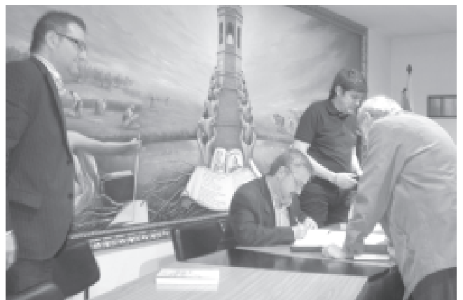
Signatura de llibres per l'autor