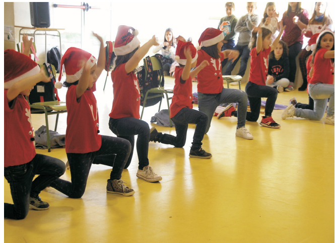
Actuació de hip-hop.