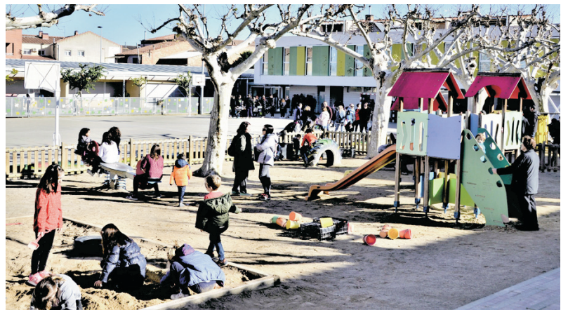
ACTIVITATS A L'ESCOLA PER LA MARATÓ