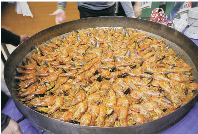
Fideuà del dinar solidari.