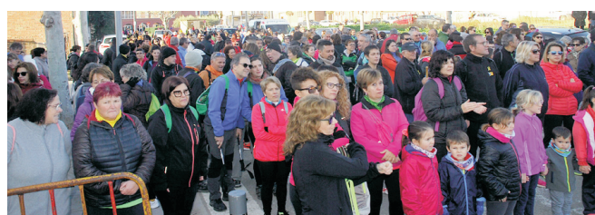
Participants a la caminada.