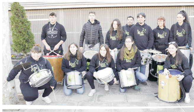
Grup de percussió Kumbeva .