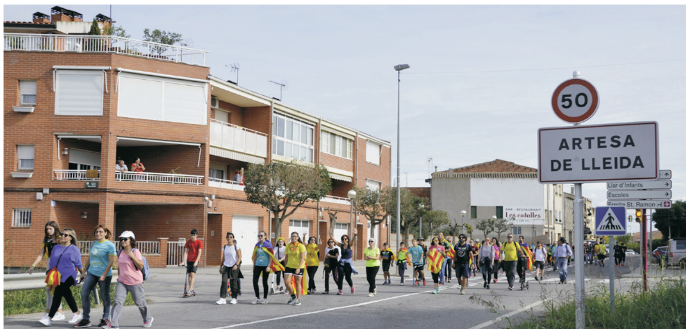
18 d'octubre, marxa de Puigverd i Artesa a Lleida en protesta per la sentència del Procés.