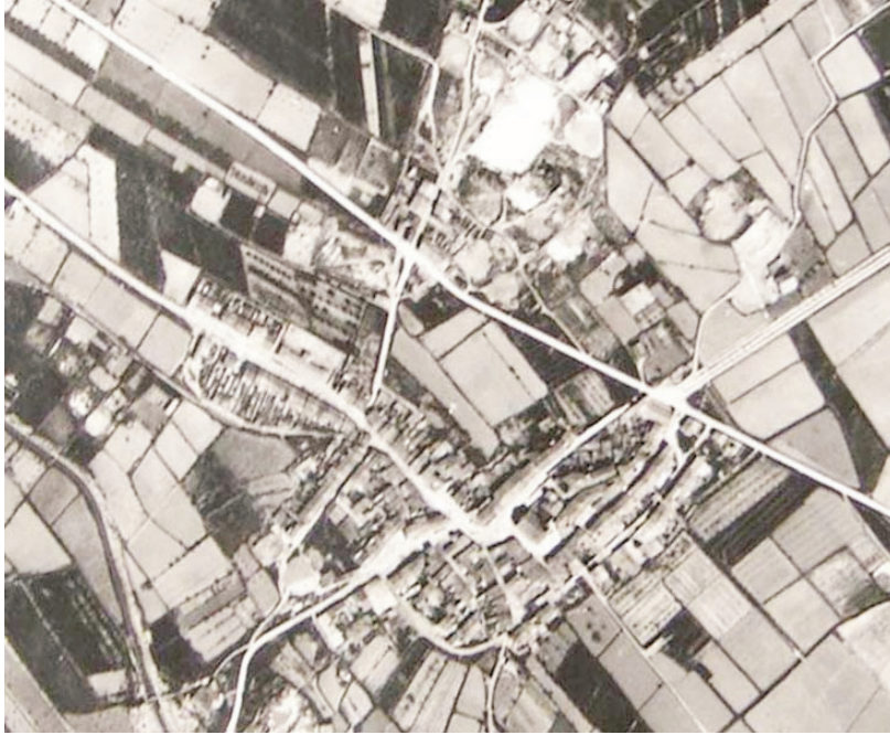
Vistes aèries d'Artea any 1954 (superior) i actual (inferior).