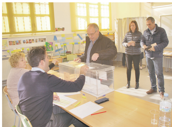
Mesa B d'Artesa de Lleida.

Els resultats en la cambra alta, on els vots són a persones concretes, foren: