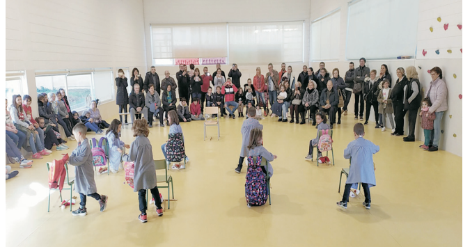
Actuació de hip-hop.