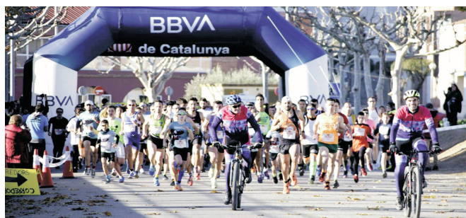
Sortida dels participants a la cursa.