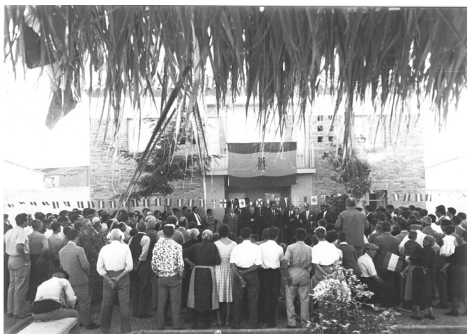
Assistents a la inauguració del grup de cases Germans Pujol Reñé (Arxiu Agrupació Cultural La Femosa).