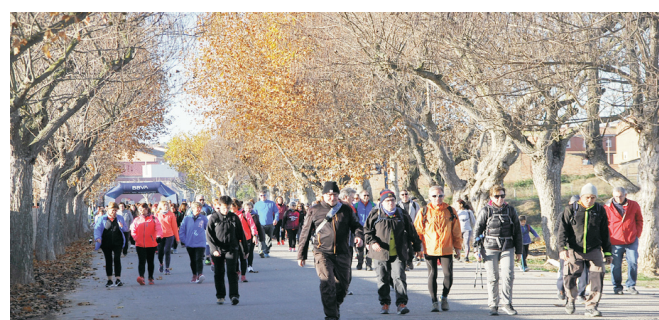
Sortida dels participants a la caminada.