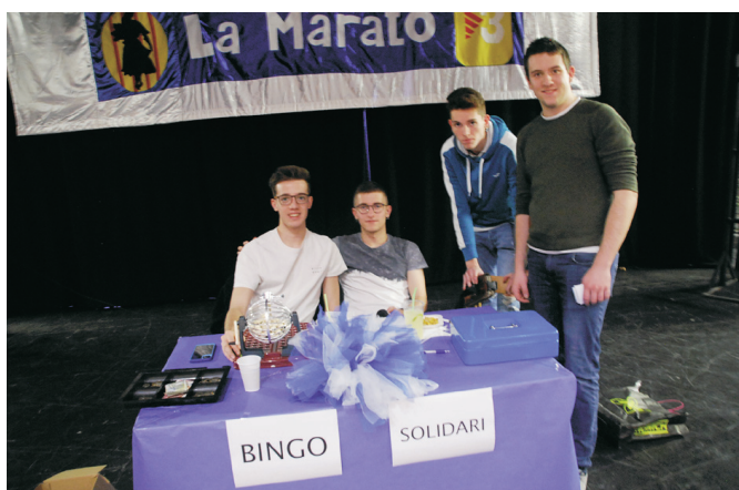
Bingo solidari de l'AJALL.