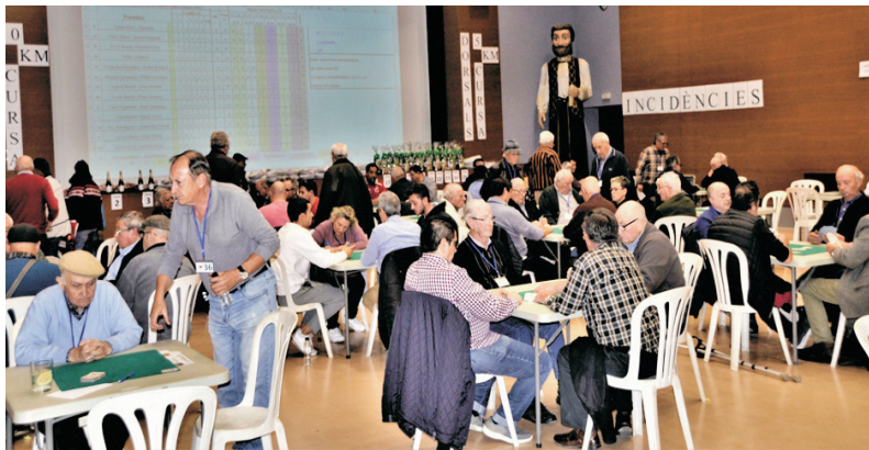
CAMPIONAT DE BUTIFARRA