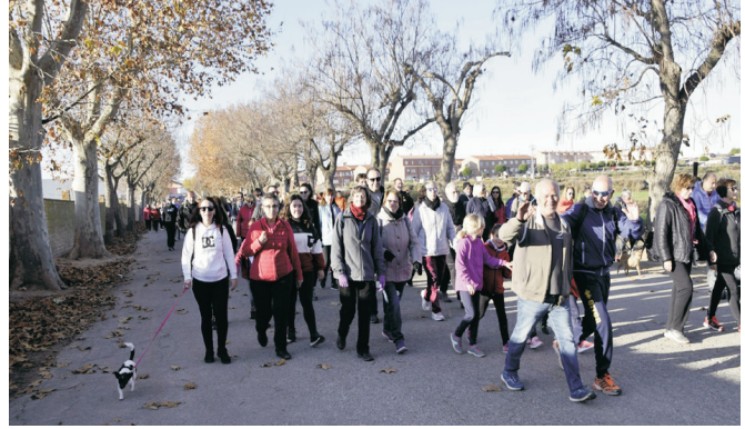
Participants a la caminada.