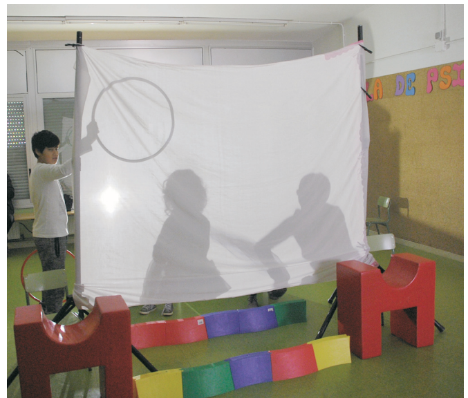
Taller d'ombres xineses.