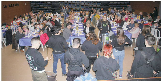
Actuació del grup de percussió Kumbeva.