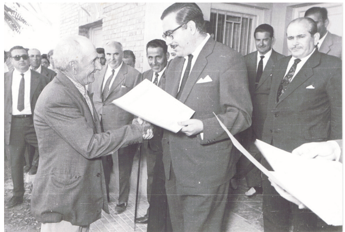
El Governador civil de Lleida, José Antonio Serrano Montalvo, lliura el títol d'adjudicació de casa a un dels socis adjudicatariis d'Artesa.