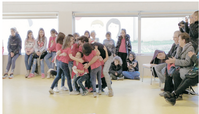
Actuació de hip-hop.