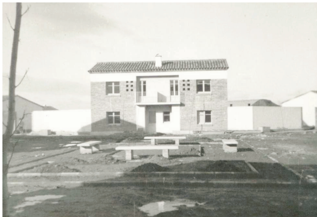
Cases qualificades de tercera categoria a la plaça del grup Germans Pujol Reñé.

Les quotes d'amortització dels habitatges van