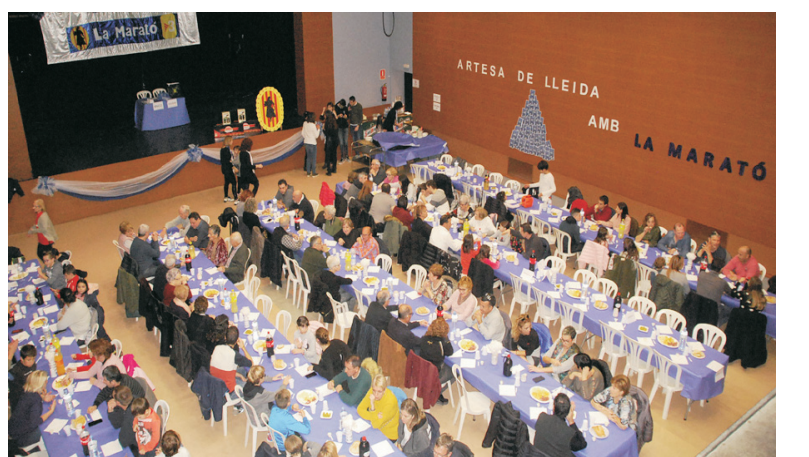
DINAR SOLIDARI DE LA MARATÓ