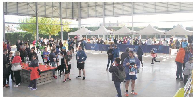
Participants recuperant forces.