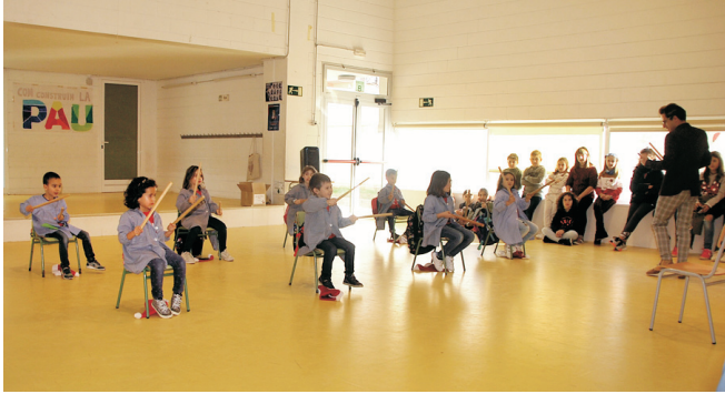
Taller de ball de bastons.