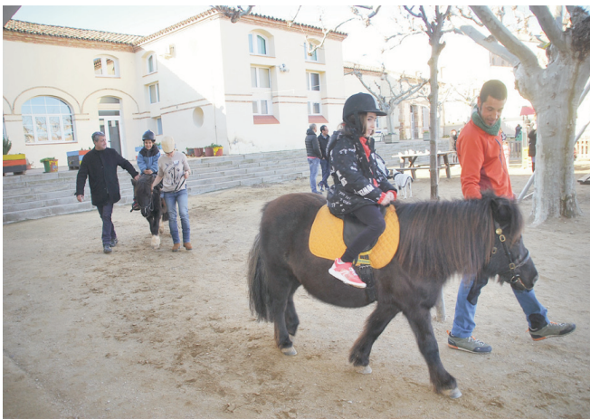
Passeig en poni.