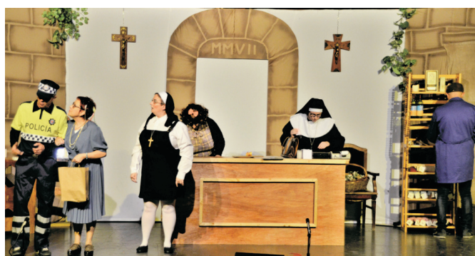
Representació de L'elixir de joventut del convent d'Alguaire .