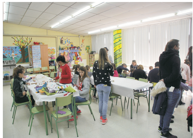
Manualitats de Nadal.