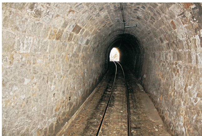
Túnel de Sóller.

Permeteu-me amb aquesta troballa fer una recomanació de cap de setmana; apunteu bé. Des d'Artesa arribar a l'estació de Sants a Barcelona, i allí amb la línia R3 fins a Puigcerdà. Veureu tot el Vallès, el pas cap a la plana de Vic i la pujada encara fins a Ripoll i Ribes de Freser; atenció quan sortiu de Planoles, perquè en cinc minuts ja esteu al túnel. Descobrireu l'encant d'una estació de Puigcerdà d'un altre segle, avui una mica demodée . Un tomb per la capital de La Cerdanya, i l'aventura de trobar un transport públic que baixi ara pel Segre, fins a casa. Ja em contareu.