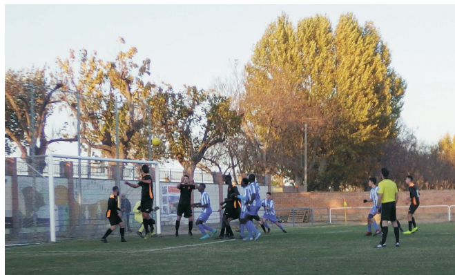
Jugada a l'àrea del Pinyana.