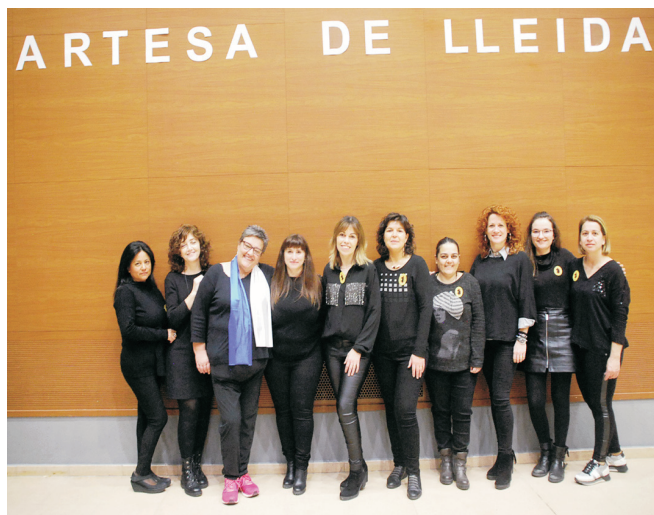
Junta de l'Associació de Dones.

Però al final han aparegut voluntàries, l'associació continuarà.