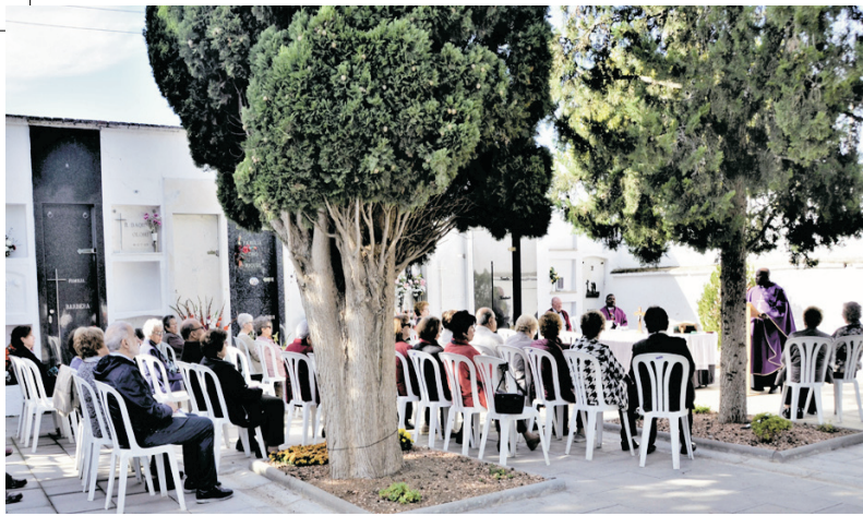
MISSA DE TOTS SANT AL CEMENTIRI