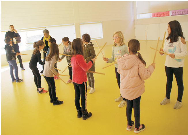
Taller de ball de bastons.