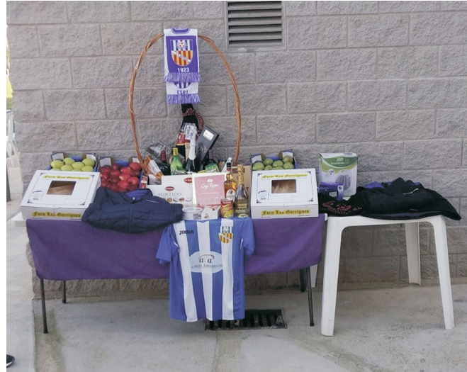
Cistella per recaptar diners per la Marató.