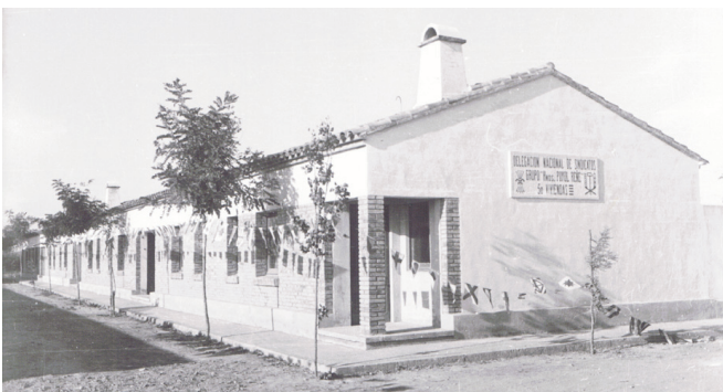
Illa de cases de protecció oficial del grup Germans Pujol Reñé.

quedar de la següent manera: Els habitatges de tercera categoria, les del número 1 al 10 en el primer període de cinc anys pagarien 308,25 ptes. mensuals; en el segon període de quinze anys