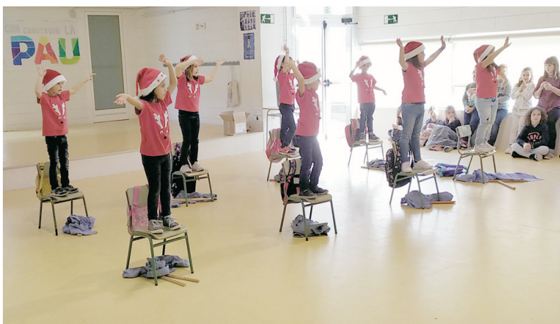
ACTUACIÓ DE HIP HOP A L'ESCOLA PER LA MARATÓ