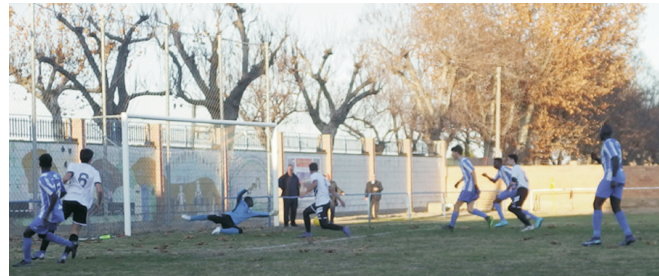
Un dels gols de l'Artesa al Tremp.