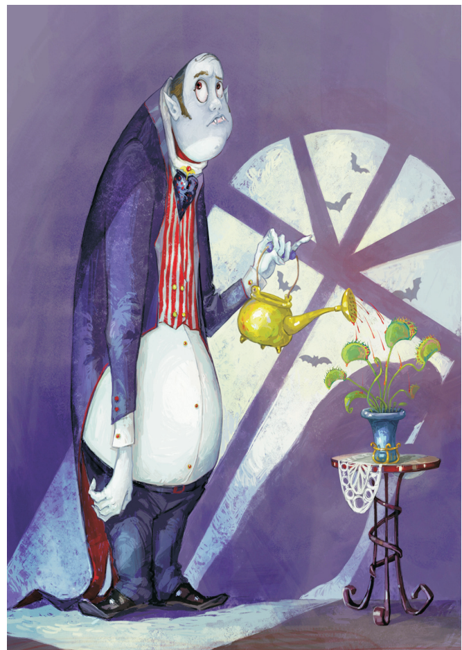
Vampir regant una planta.

Així doncs, aquest text no és més que un missatge d'alarma per tots aquells que surten de nit, ja que qui sap si un dia, enmig de la foscor, un grup de grallers apareixeran del no-res disposats a fer esclatar el cap del primer bonifaci que passi per allà.