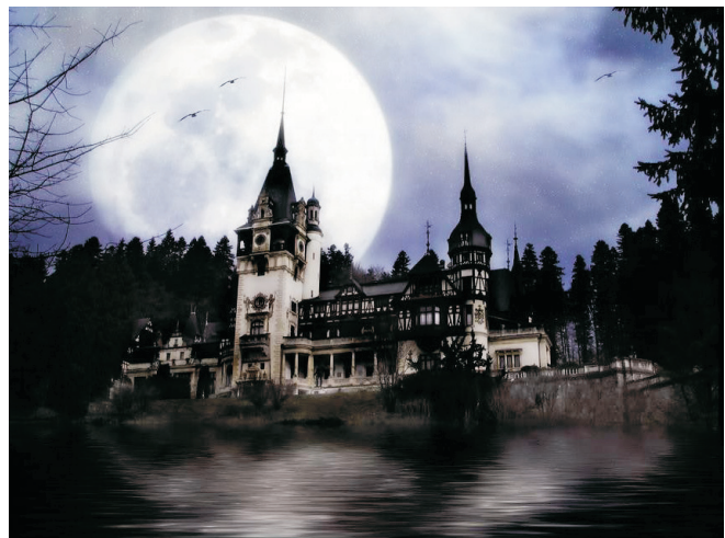
Castell del vampir.

Però quan per fi es disposava a clavar els seus afilats ullals en el coll desprotegit d'aquelles restes mortals, un so exageradament estrident