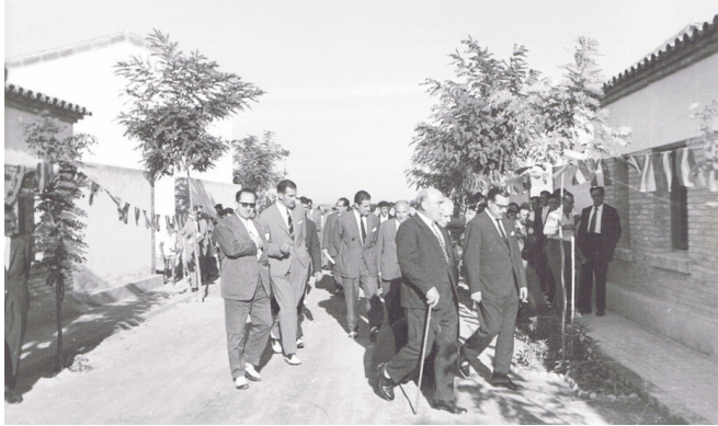
Comitiva d'autoritats provincials i locals el dia de la inauguració del grup de cases Germans Pujol Reñé.

d'aquest esdeveniment i en va donar una àmplia informació escrita. També un reportatge gràfic realitzat pel fotògraf lleidatà Josep Gómez Vidal complementà aquesta inauguració. Aquest reportatge gràfic, de gran valor pel poble, l'Agrupació Cultural La Femosa, el va poder recuperar i incorporar al seu arxiu fotogràfic (15).