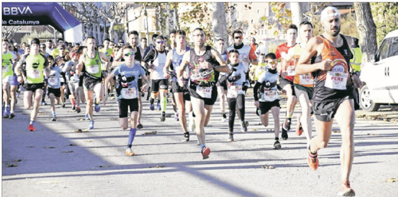
Un grup de participants durant els primers compassos de la carrera.