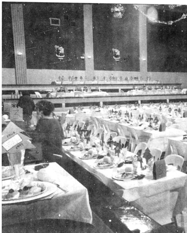
Preparant la revetlla de cap d'any.