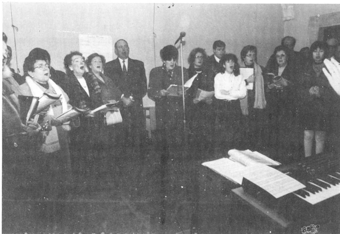
Cantada de la "Coral d'Artesa".