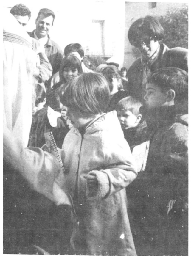
El Camarlenc dels Reis recollin les cartes dels infants.