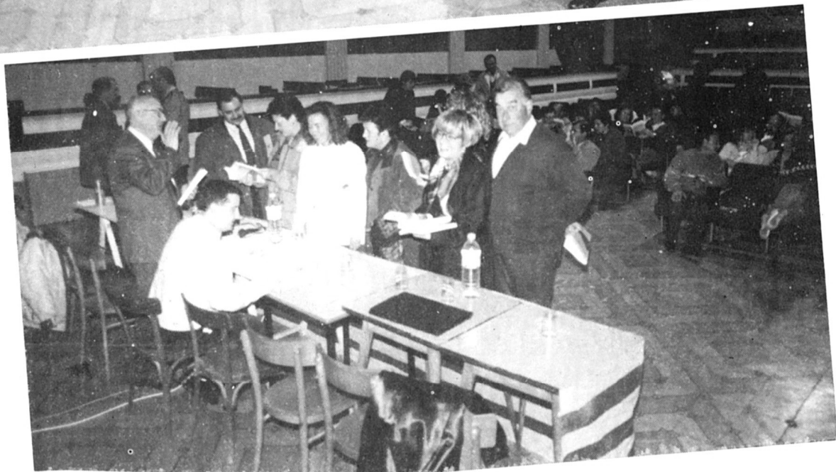
La presentació del primer llibre de la HISTÒRIA D'ARTESA DE LLEIDA.