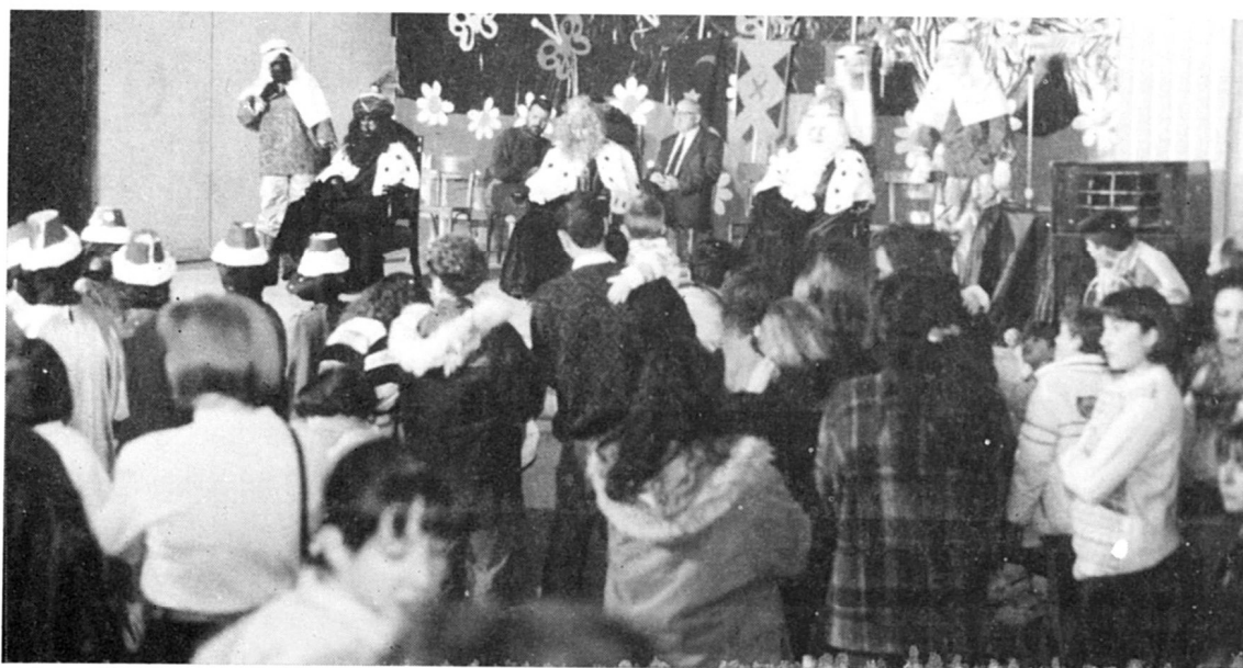
L'arribada dels Reis Mags.