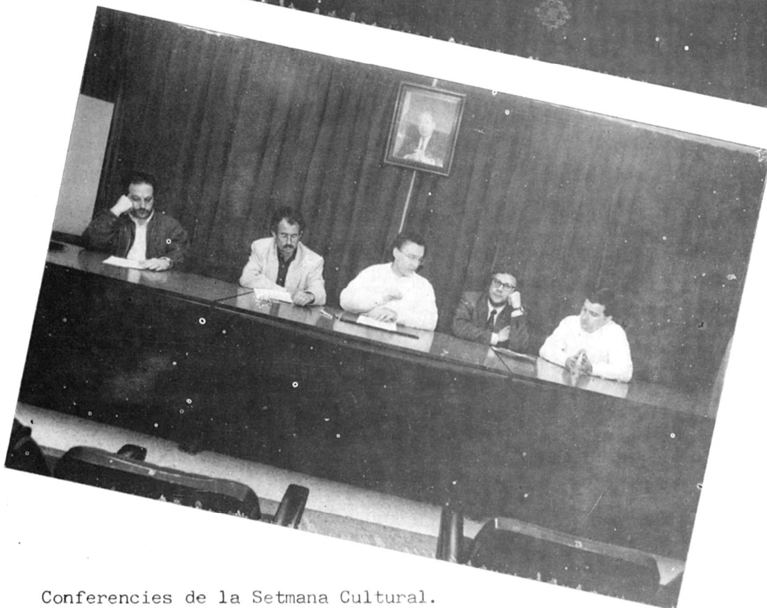
Conferències de la Setmana Cultural.