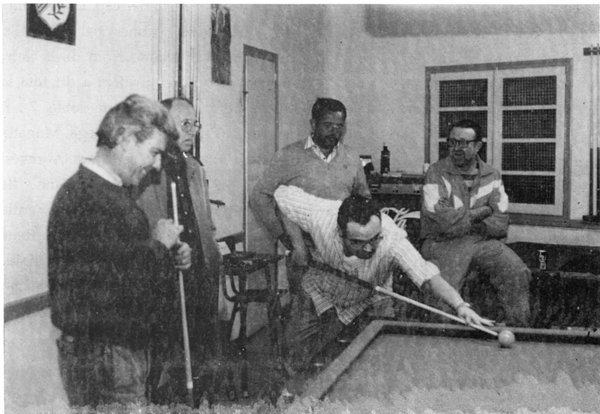
Alguns compnents de l'Associació de Bitllar d'Artesa