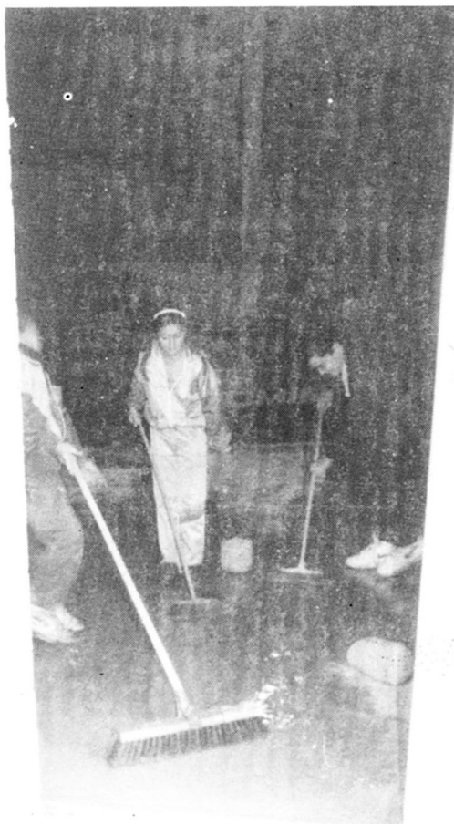
Membres del club T.T. traïen aigua de la pista de joc.

A més el d'aquests dos equips el C.T.T. Artesa de Lleida té un grup d'aprenentatge al qual convida a tots els nens i nenes a partir dels nou anys, l'horari d'entrenament els dilluns (7 tarda), dimecres (2/4 de 8), i dissabtes (12 migdia).