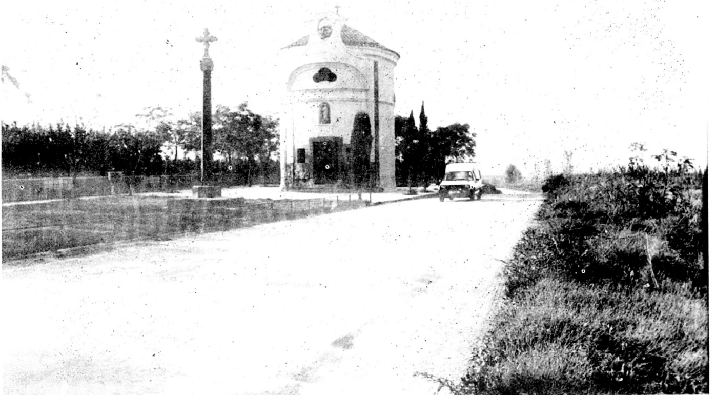
Sant Ramon en l'actualitat: