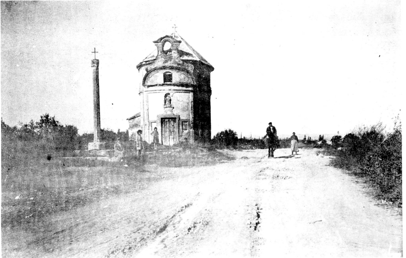
Sant Ramon, als anys vint.