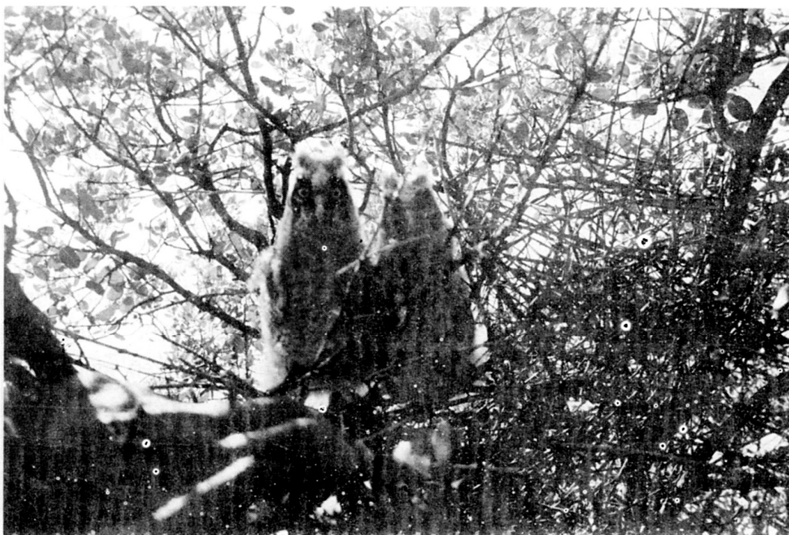
Polls de mussol banyut.