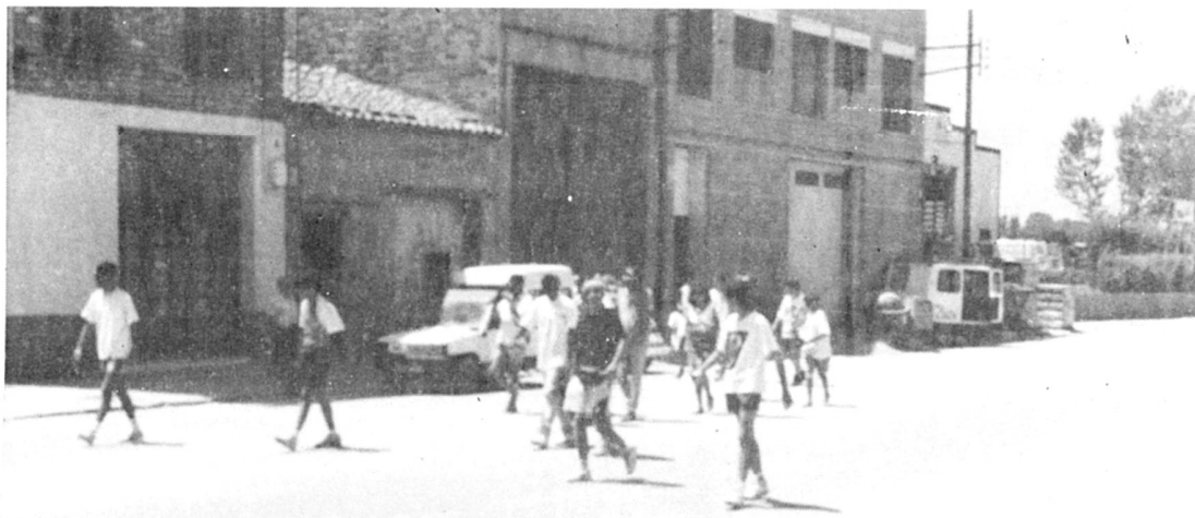
El pasacarrers dels quintos.

Per amenitzar la vetllada es va comptar amb el grup local musical ELS TARTANYS.