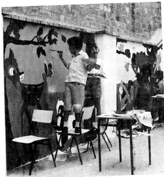
Els alumnes pintan el mural del pati de les escoles.