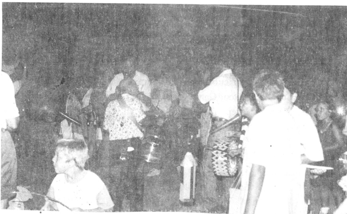
Cercavila de Sant Jaume.

la pista poliesportiva on els Quintos 95 d'Artesa van ser els encarregats d'organitzar la sessió de ball.