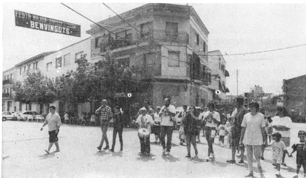
Cercavila de Festa Major.

Un any més va quedar constància del gran èxit en quant a participació de gent a tots els actes, i del gran nombre d'amics i parents que varen assistir-hi.