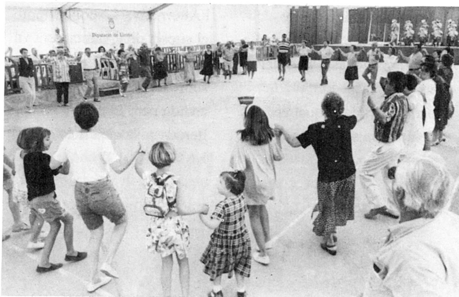
Ballada de Sardanes de Festa Major.