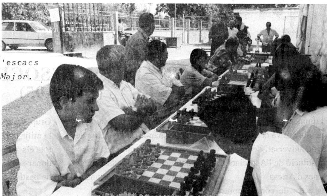
El concurs d'escacs a la Festa Major.

Per tal d'emmarcar tota aquesta panoràmica, l'Alternativa Ecologista amb el suport de l'Ajuntament va col·locar una exposició sobre temes medio-ambientals cedida per l'Institut d'Estudis Ilerdencs, la qual duia el títol LA TERRA I TU.