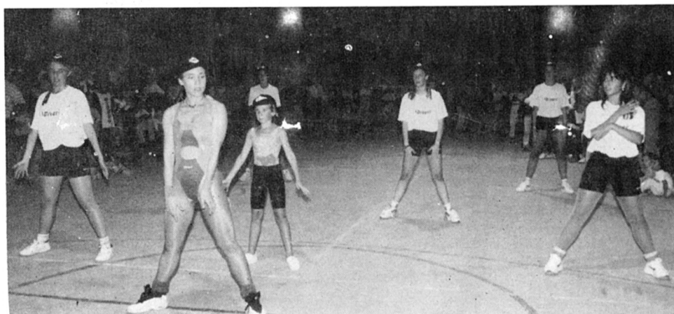
Demostració "d'Aerobic" del grup d'Artesa.

Artesa a 20 d'agost de 1995 Felip Domènech i Costafreda