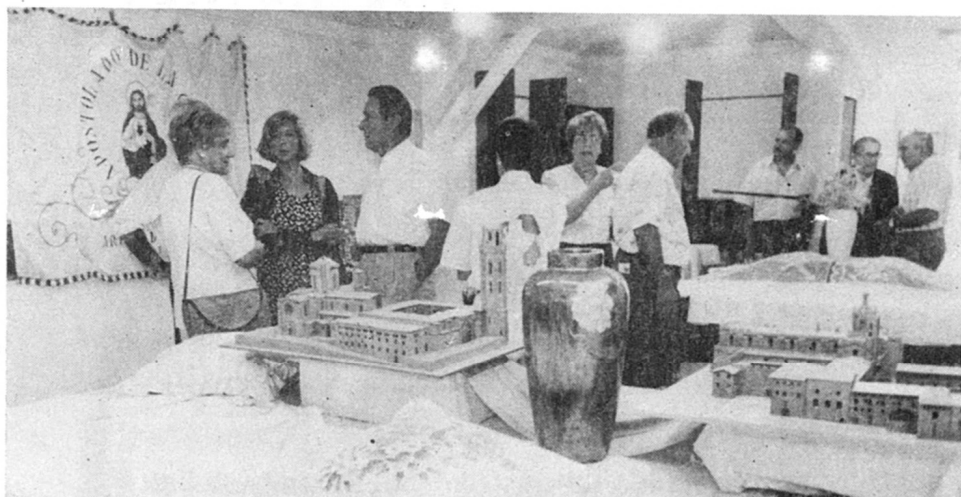
Exposició de treballs manuals.