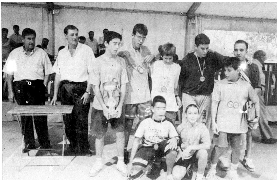
Els finalistes del concurs de tennis taula.