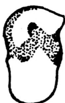
LLUNA O LLUNETA