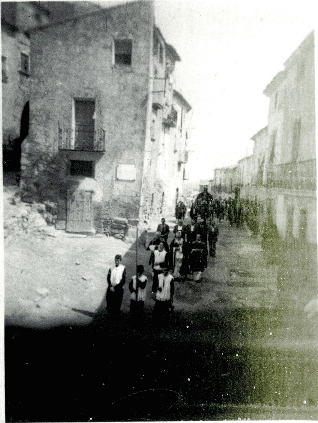
CARRER DELS GALLART : ENTERRAMENT. ANYS SEIXANTA