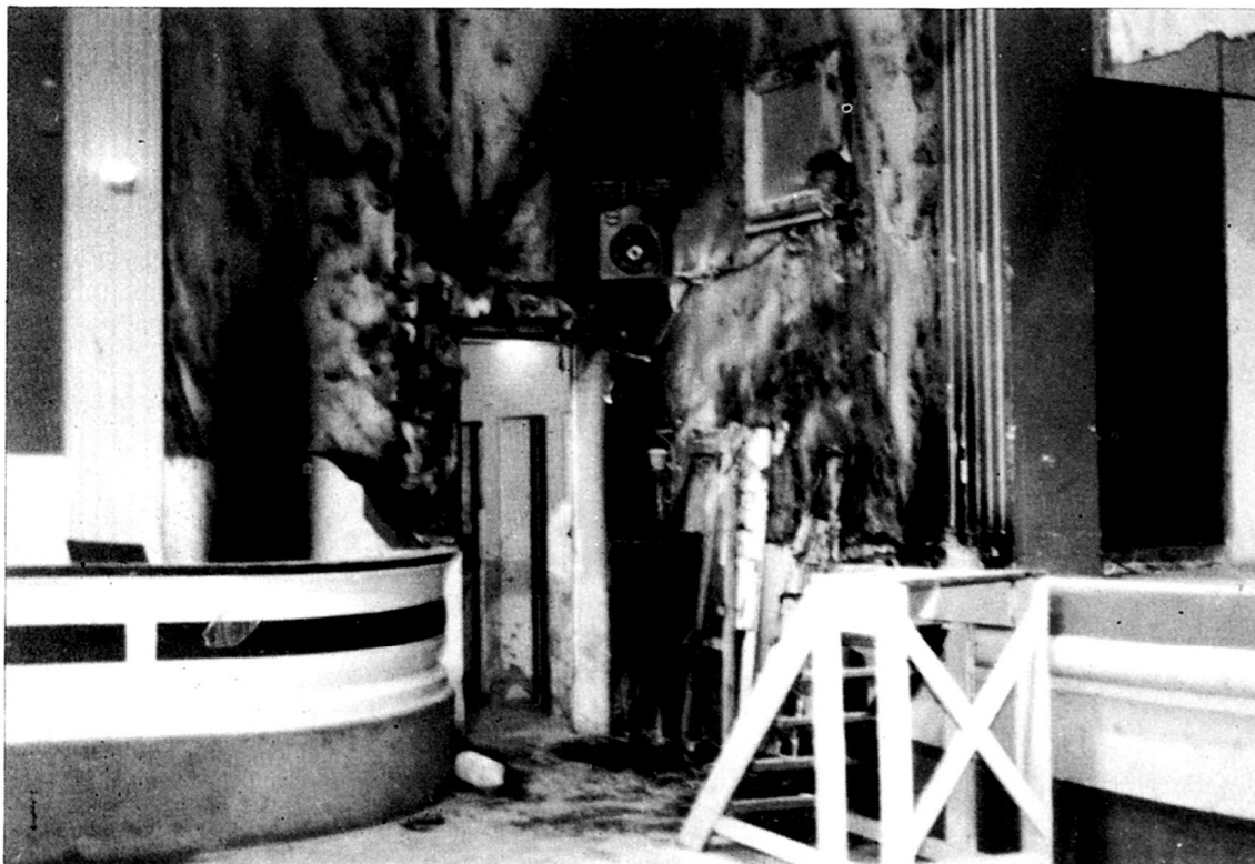
Incendi a la Sala de la Llar del Poble.

Es difícil per no dir impossible saber d'on va sortir el foc, i quin fou el motiu del seu inici, però sembla que hi ha força indicis per la manera com aquest va provocar-se que orienten a pensar que el motor que feia moure les cortines automàticament i que aquell diumenge havia d'estrenar-se en va ser el causant directe o indirecte.