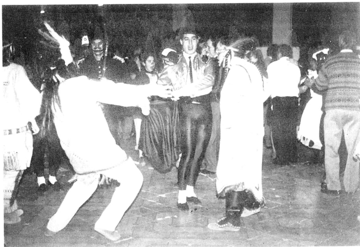
BALL DE DISFRESES.