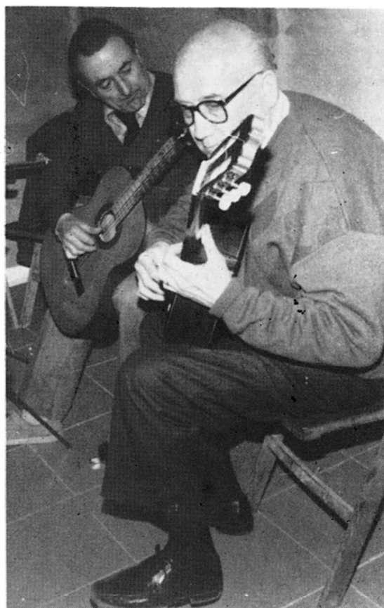
BESORA i DRUDIS

Concert de Música : (Cloenda dels " DIVENDRES CULTURALS " )