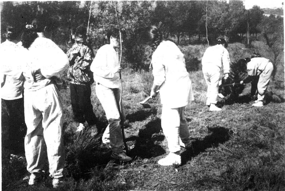
La plantada d'arbres pels alumnes de les escoles

Així durant el matí la quitxalla del col·legi van procedir a plantar arbres, en l'indret conegut com a Racó del Jové . Com a compensació a l'esforç realitzat, l'Ajuntament organitzar un dinar col·lectiu al Racó del Jové.