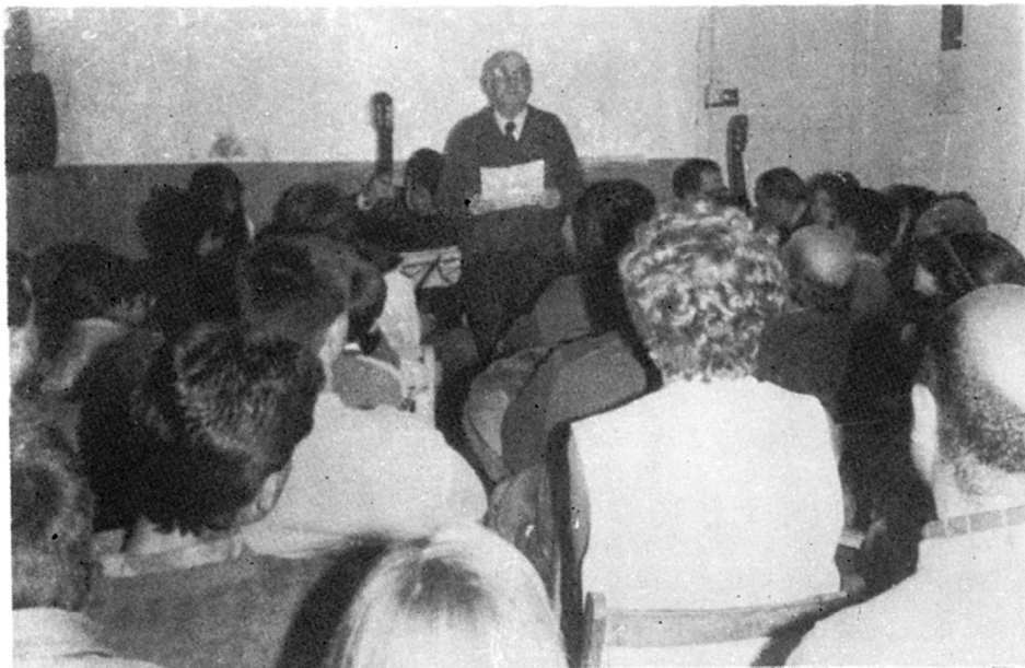
Concert de Música per a clausurar els "DIVENDRES CULTURALS"