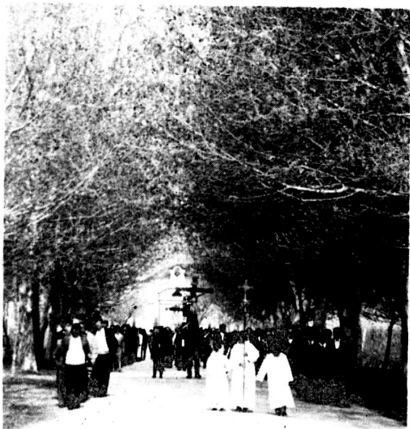
LA NOSTRA PORTADA