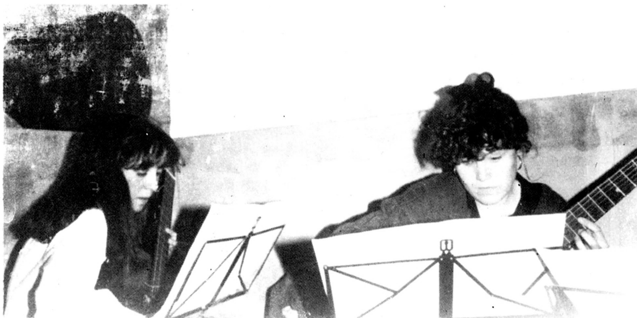
ROSER i L'EVA, al concert de música