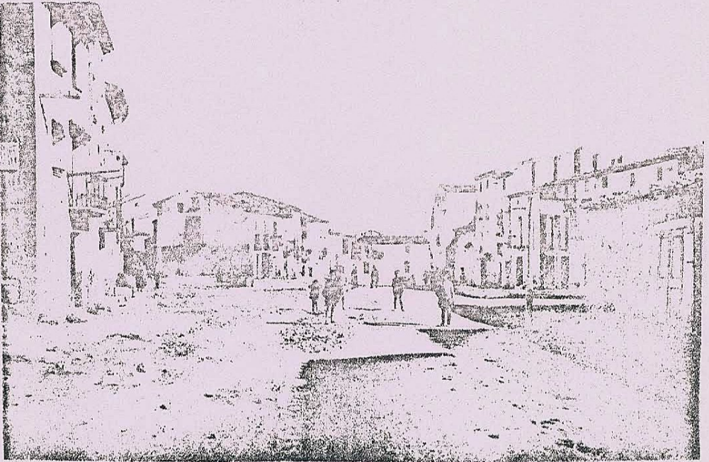
EL CARRER DEL CASTELL ALS ANYS 30