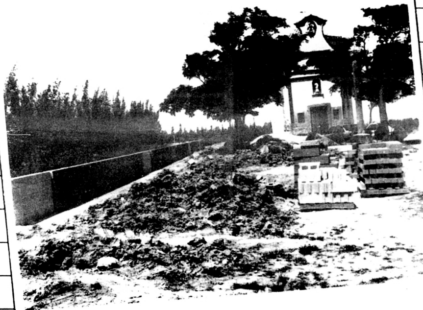
SANT RAMON OBRES DEBELLIMENT A L'ENTORN DE L'ERMITA